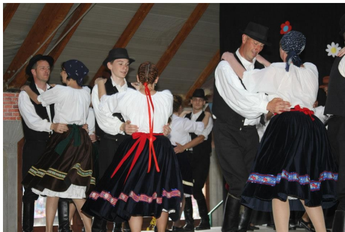
Felnőtt csoport—Rábaközi táncok

A rendezvényen 5 produkciót láthatott az igen szép számban megjelent nagyérdemű. Elsőként a felnőtt csapat lépett színpadra egy rábaközi táncokat tartalmazó koreográfiával. Őket a legifjabbak követték, s előadásukban népi játékok, mondókák, gyermekdalok, népdalok elevenedtek meg egyszerűbb tánclépésekkel fűszerezve. Ezután ismét szenior csoportunk lépett a közönség elé, ezúttal a felső Tisza-vidékről származó szatmári táncokkal. Legrégbben működő, iskolás csoportunk mátyusföldi táncokat mutatott be, majd a felnőtt csapat moldvai táncai zárták a program színpadi részét.