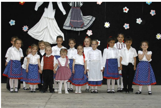
A legifjabb táncosaink