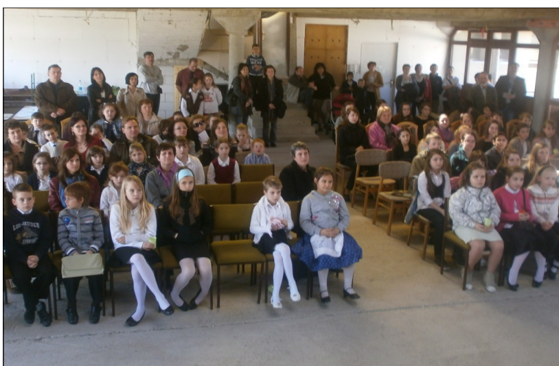
A szavalóverseny megnyitója