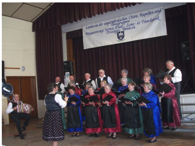
A Steixner István Német Nemzetiségi Énekkar Városlődön, a VI. Országos Kórustalálkozón