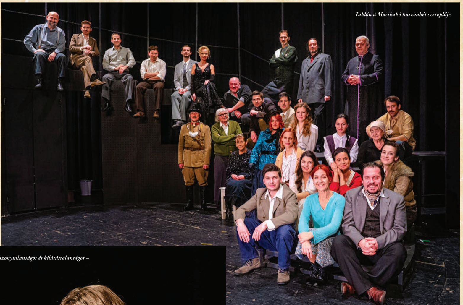
Tablón a Macskaköbök huszonhét szereplője