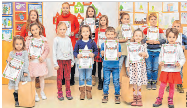
A rajzpályázat – a díjátadón részt vett – díjazottjai

A pályázaton valamennyi helyi óvoda és általános iskola képviseltette magát, de szép számmal érkezett nevezés a környékbeli településekről is, mint például Fadd és Szekszárd. Az alkotások legnagyobb részét a ceruzarajzok tették ki, de mivel formai megkötés nem volt, ezért festmények, ragasztott