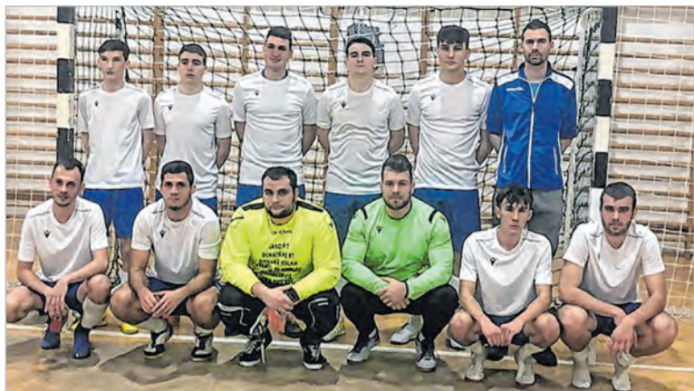
Jó játékkal szerezte meg idénybeli negyedik pontját a Tolna-Mözs

A Tolna-Mözs az új év első meccsén január 16-án lép parkettre Tolnán, az ellenfél a PTE PEAC.