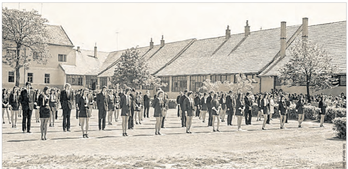
Gimnáziumi ballagás 1973-ban. Háttérben az Arany János utcai szárny és a régi kolostor egy része

tek, a kovácsműhely és egyebek, raktárak és szaktermek lettek. A kolostorépületben tanári lakásokat alakítottak ki. Elég kellemetlen volt ez a diákok számára, hiszen a tanárok a szünetekben akár az otthonukból is figyelhették a diákok minden lépését az udvaron. Viszont