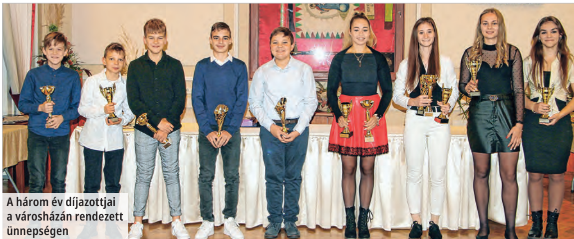
A három év díjazottjai a városházán rendezett ünnepségen