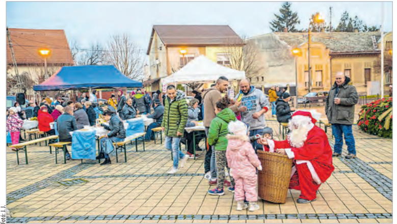
Bagdulyás, sütemény, zsíros kenyér és a Mikulás puttonya

A Dunamenti Polgári Egyesület, a Háló Közalapítvány és a Nagycsaládok Tolnai Egyesülete közösen látta vendégül a Városháza elé érkezőket. A fő fogás bagdulyás volt, ezenkívül süteményeket, zsíros kenyeret, teát, forralt bort is kínáltak a civil szervezetek tagjai, az utóbbiak megvásárlásával a Háló Közalapítvány és a Nagycsaládok Tolnai Egyesületének támogatására nyílt lehetőség. A karácsonyi hangulat és a finom ízek felsorakoztatása mellett az akcióval a szervezők célja volt az is, hogy alkalmat teremtsenek a találkozásra, beszél-