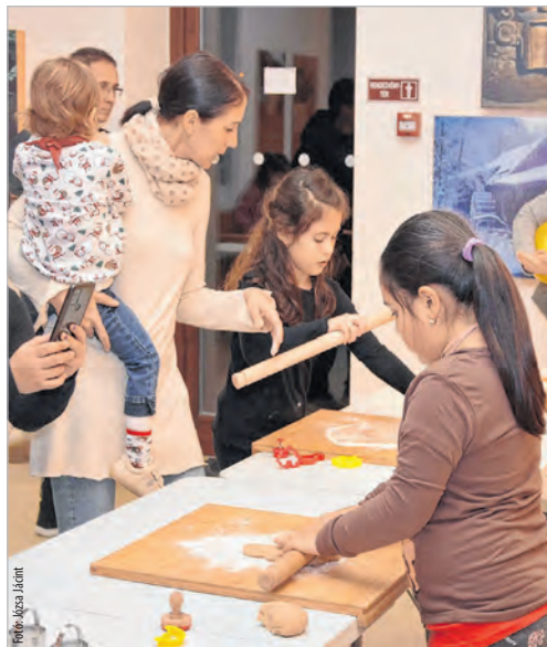
Luca-napi hagyományörző foglalkozás

December 10-én Gabona Babona címmel Luca-napi hagyományörző foglalkozás várta a kicsiket a MAG-Házban, ahol a búzaültetés mellett a szaloncukor- és mézeskalácskészítésből is kivették a részüket a gyerekek, sőt a bátrabbak Luca székére állva még boszorkánylesre is vállalkoztak. December 17-én szinte egésznapos programot rendeztek a kulturális központban. Délelőtt a FoltoZoo csapatának közreműködésével karácsonyi manókat varrhattak a résztvevők, délutántól pedig adventi vásárral, táncbemű-