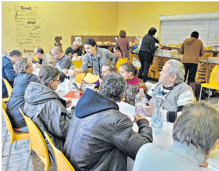
Ezúttal a gimnázium ebédlőjében látták vendégül a rászorulókat

December 17-én került sor a helybéli karitászcsoport karácsonyi vendégségére, ahová ez alkalommal is vártak közel 30 embert. Főleg olyan anyagi gondokkal küszködőt, akiről tudható, hogy magányos, hogy elesett, vagy valamilyen más okból ünnepelni képtelen a maga erejéből. Ez az évről-évre megvalósuló törekvés egyidős a helyi csoporttal, ami azonban az idén váratlan nehézségbe ütközött. Mégpedig abba, hogy akár egyetlen egy hétvégén is fűtött helyiséget találjanak, még hozzá olyat, ahol tálalni és étkezni is lehet. Az eddigi helyszínek ugyanis az energiatakarékosságra