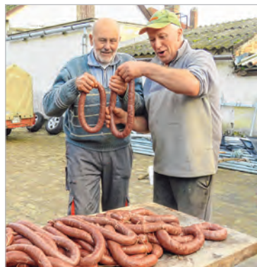
Ide programokra is jut a karácsony előtt készült finom falatokból