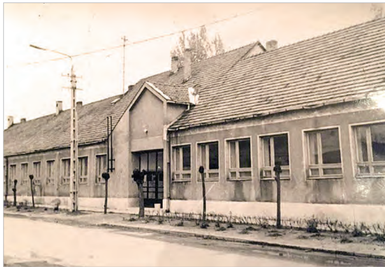
A gimnázium épülete a Bajcsy-Zsiliszky utca felől

ki a laktanyát. Az egykori templom helyére egy mosókonyhát emeltek. Volt kantin, kovácsműhely, sütőház, raktárak és minden egyéb, ami egy laktanyához szükséges. (A nagy laktanya felépülése után itt a tűzér állomásoztak.) Nem volt ez szép épület, a kolosto-