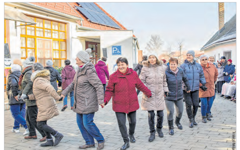
Tánc a tolnai idősek napközije udvarán

A repertoárt ezúttal egy memóriafejlesztő gyakorlattal is kiegészítették, amelyet nemcsak az idősek, hanem bárki kipróbálhatott a Tolnai Kulturális Központban tartott Adventi kavalkád alkalmával, ahol végül még a közönséget is sikerült a táncparkettre csábítania a fellépő szenioroknak. J.J.