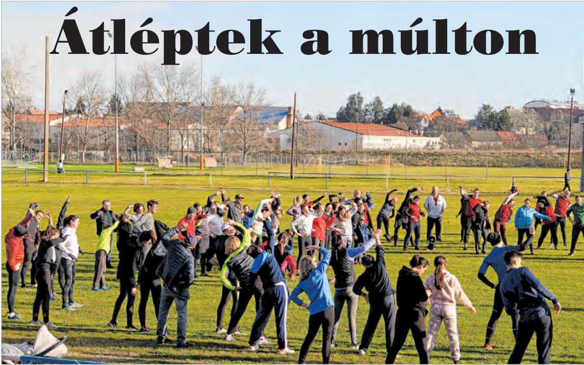
A szilveszteri futás résztvevői a zenés bemelegítést sem hanyagolták el