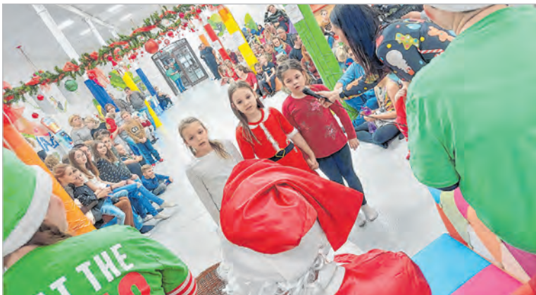
Ajándék járt a produkciókért