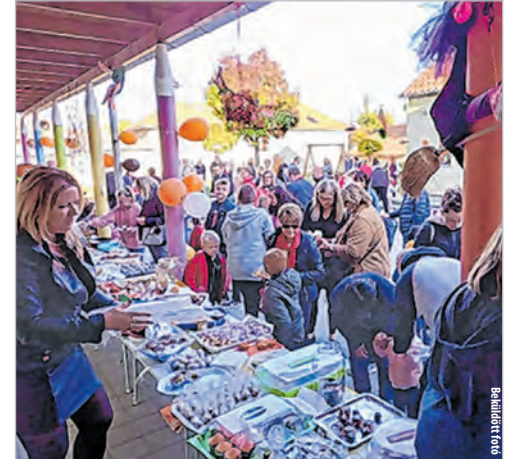
Jótékonyági vásárt is rendeztek a Pitypang oviban

Emlékezetes program volt a „rongyos hét” is, az európai hulladékcsökkentési héthez kapcsolódva, amelynek középpontjában ezúttal a textíliák újrahasznosítása, a ruha-