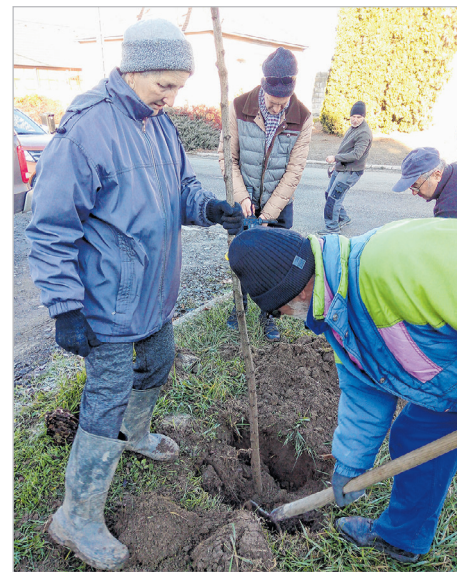
Tíz gömbakác került földre

A mostani faültetés a Bethlen Gábor Alapkezelő támogatásával, a Tolna Megyei Szabadművelődési és Népfőiskolai Társaság közreműködésével történt.