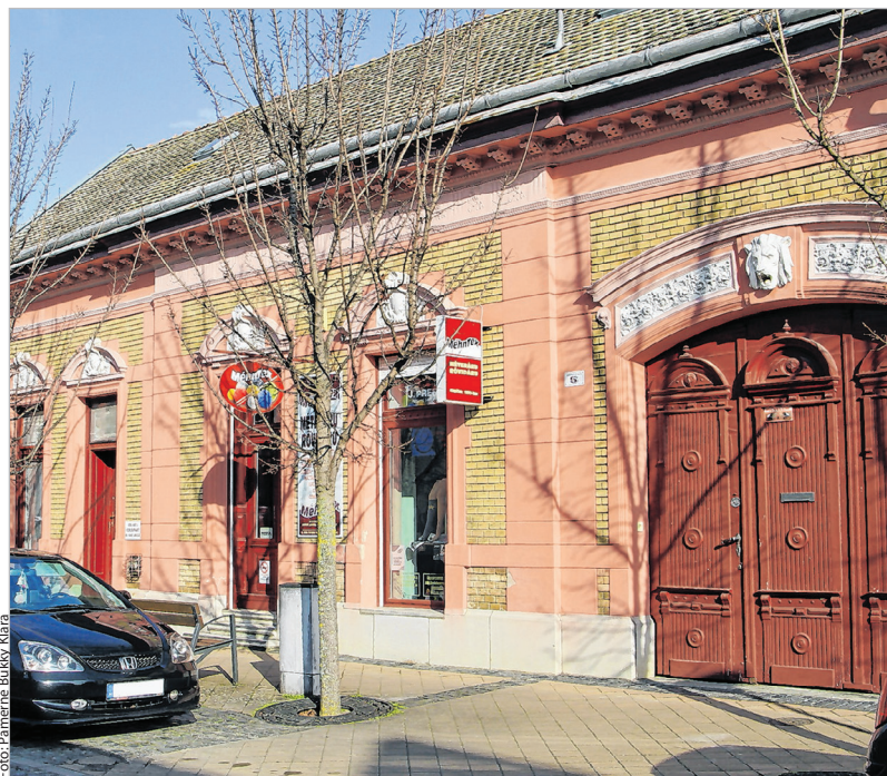
A szép Árpád utcai ingatlanok egyike, a Méhn-ház

Az 1906-ban épült Méhn-házat szinte mindenki ismeri (Árpád utca