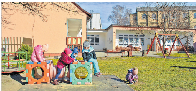
A Selyem ovi felújítására is pályáznak

Rendkívüli ülést tartott a képviselő-testület január 27-én. Az eseményen többek között a JETA-pályázat beadásáról is döntöttek.