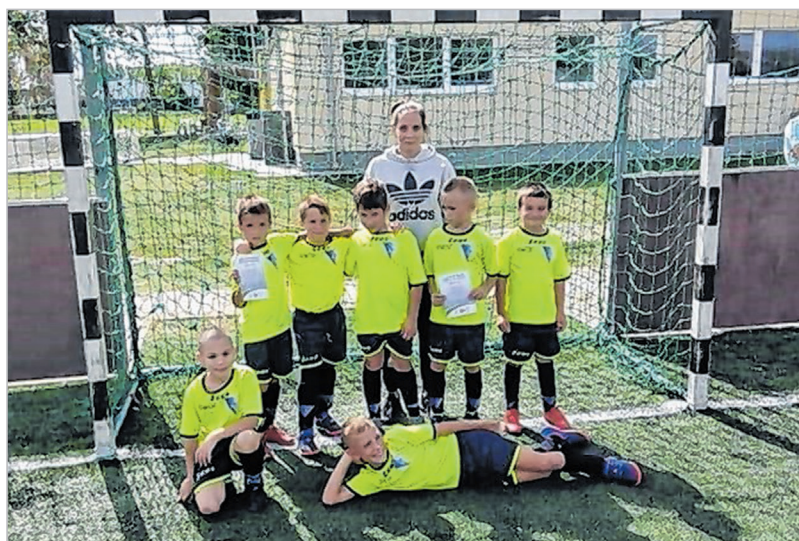
Az U9-es csapat élvezi a Bocsik-program meccseit

A nagypályás szezon szeptemberben indult. Jelenleg 5 győzelemmel és 1 döntetlennel Tamásival holtverseny-