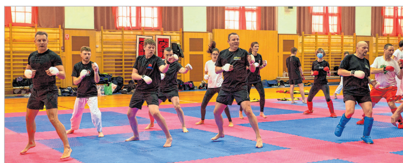
A Lovardában rendezett workshopon hetven karatéka vett részt

A klub hagyományos nyári edzőtáborát Domboriban rendezték, 27 fővel. A sportolók napi négy edzé-