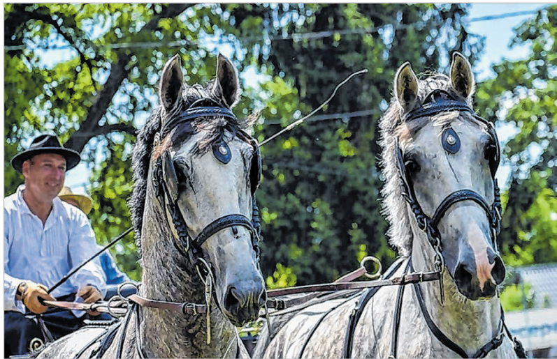
Ezt a két paripát vitték ki Hollandiába

– Ahogy azok is voltunk. De csak voltunk. Ebben a hollandok már messze leléptek bennünket. Mi is szeretjük a lovat, sok lópart – köztük én is – érzelmileg kötődünk a lóhoz. Ők értenek is hozzá. Sok évtizedes, na-