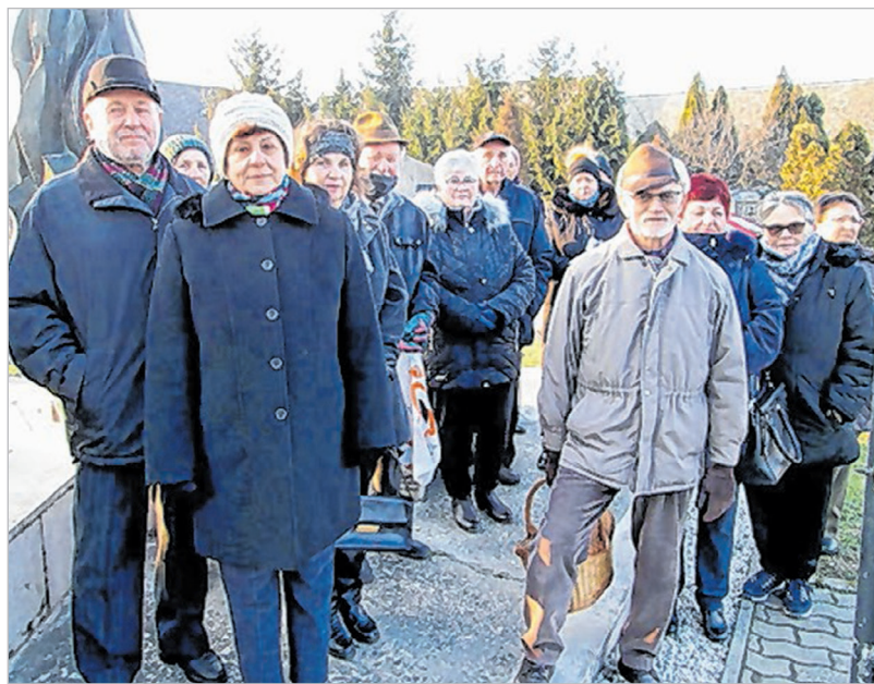
A mözsi megemlékezés résztvevői

Idén is megemlékeztek Mözsen a II. világháború doni tragédiájáról és az áldozatokról.