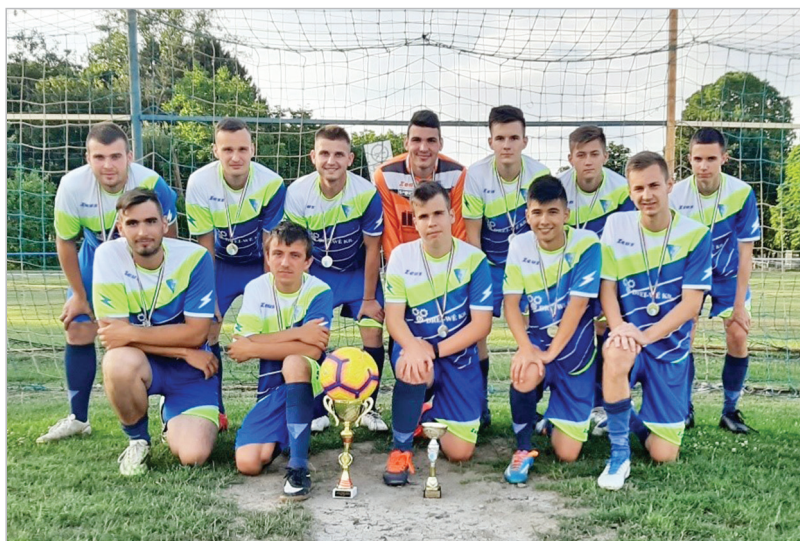
Az U19-es csapat ezüstérmes lett a bajnokságban