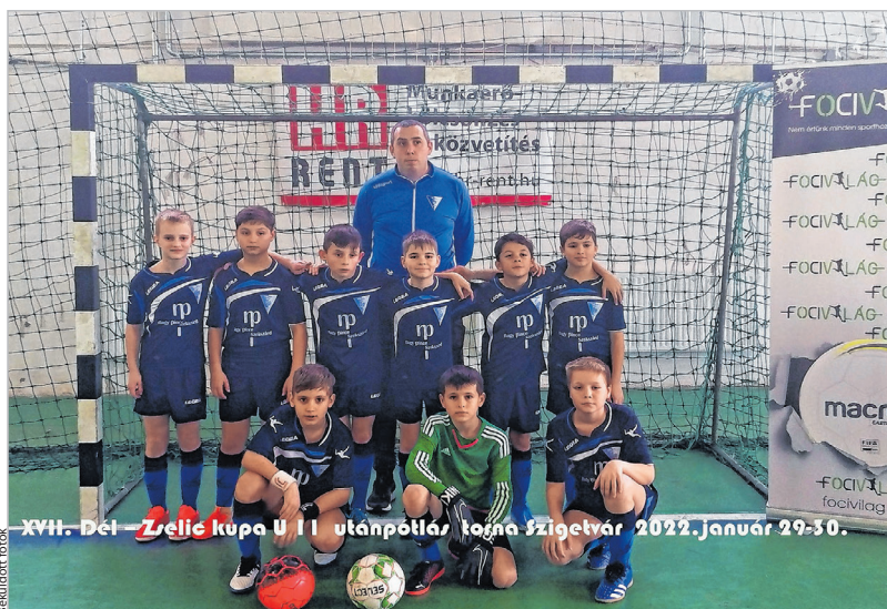
Az U11-es gárda legutóbb a szigetvári Dél-Zselic Kupán diadalmaskodott