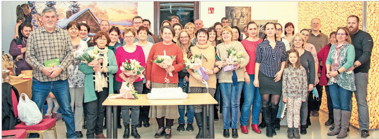
A fotózás és a tortaevés idejére lekerült a maszk az ünneplők arcáról a jubileumon

A Nagycsaládosok Országos Egyesülete kitüntetését, a NOE-díjat három vezetőségi tagjuk is megkapta, a legrangosabb NOE-elismerést, a Hűség-díjat pedig a korábbi elnök vehette át.