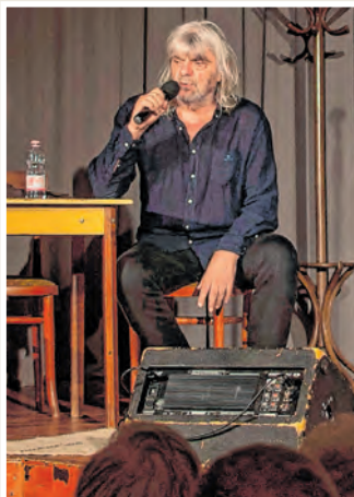
Hobo ezúttal Ady műveket adott elő

Az utolsó előadásán a program helyi szervezője, Tóth Györgyi elmondta, hogy ezzel nem ért véget az előadásorozat, sikerrel pályáztak egy 2022-es programra, amit a közönség őszinte lelkesedéssel fogadott. Link Judit