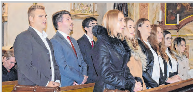
A bérmálkozók a tolnai templomban