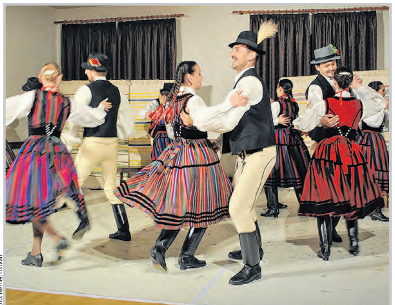
Fergeteges előadásnak tapsolhatott a közönség