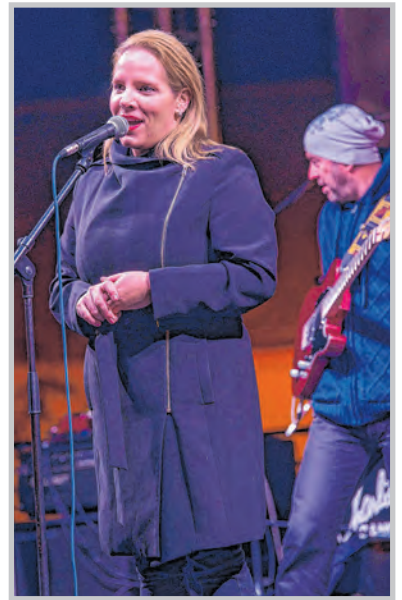
Tóth Vera is megmelengette a közönség lelkét

Az idén 74. életévét betöltő művész másfél órás koncertjén pályafutásának legnagyobb slágereivel örvendeztette meg késő estebe nyúlóan a tolnaiakat, akik többször vele együtt énekeltek a jól ismert dalokat. J.J.