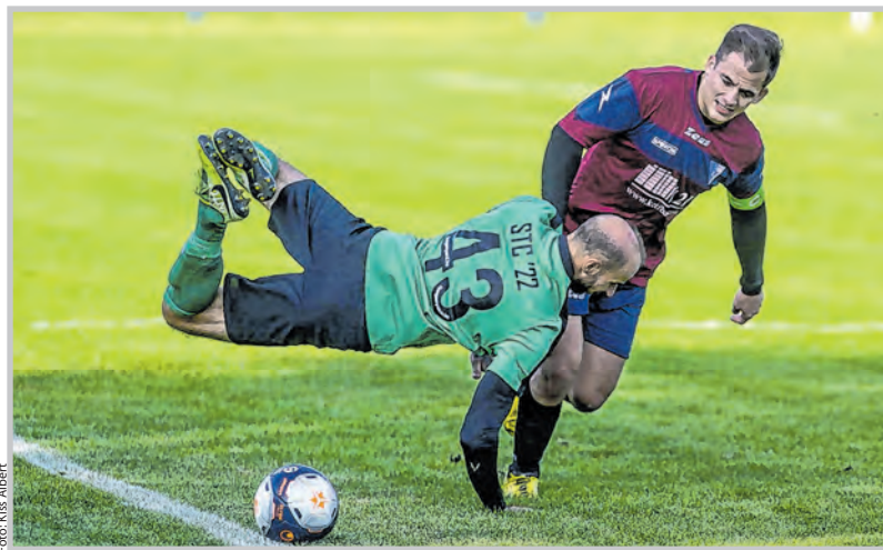
Sós Gergőék kétvállra fektették a Simontornyát is

A Tolna az első, a Simontornya a negyedik pozícióból várta a megyei II. osztályú bajnokság nyolcadik fordulójának rangadóit. Rangadó ide vagy oda, a tolnaiak végig fölényben futballoztak, ami a második félideben gólokban is megmutatkozott, így tel-