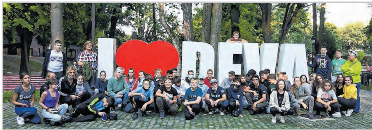
Dévát is érintették a kirándulás során

A Határtalanul program célja a magyar-magyar kapcsolatok építése, ápolása. Ennek keretében tolnai általános iskolások erdélyi kiránduláson vettek részt.