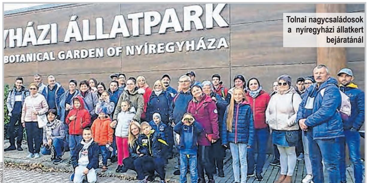
Tolnai nagycsaládosok a nyíregyházi állatkert bejáratánál

Köszönet a NOE, a nyíregyházi és a Nagycsaládosok Tolnai Egyesülete szervezőinek!