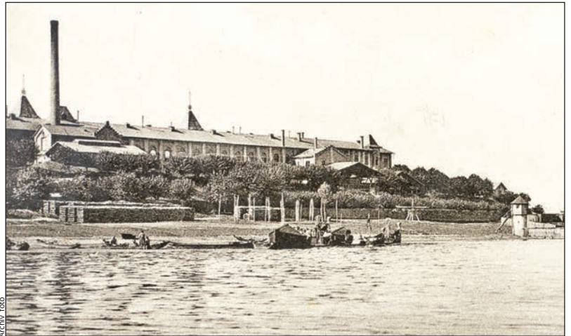
A tolnai Selyemgyár gépei már a kezdeteknél is villamos energiával működtek

A Tolna nagyközség villamosításának története című tanulmány 2015 óta a városi értéktár kincse. Link Judit