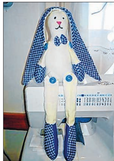
Kockásfülű nyúl, foltokból

– Koronavírus ellen egyelőre nem oltunk gyerekeket – mondja –, csak 16 év fölötti fiatalokat. Több tapasztalat kell ahhoz, hogy elkezdjük, de valószínűleg az év végére már lehetőség nyílik erre. Sok a covidos gyerek, de gyorsan átszalad rajtuk a betegség, és enyhe lefolyású. A legjellemzőbb tünetük a száraz köhögés, amit az esetek többségében láz is kísér. Hál' Istennek nincs fulladás, nincs kórházközelet állapot. Ám ahhoz, hogy gyermekek oltására is engedélyezzenek egy szert, több klinikai tapasztalat, sok esetszámból levont gondos következtetés, nagyobb óvatosság, alaposabb ismeret szükséges. –WY–