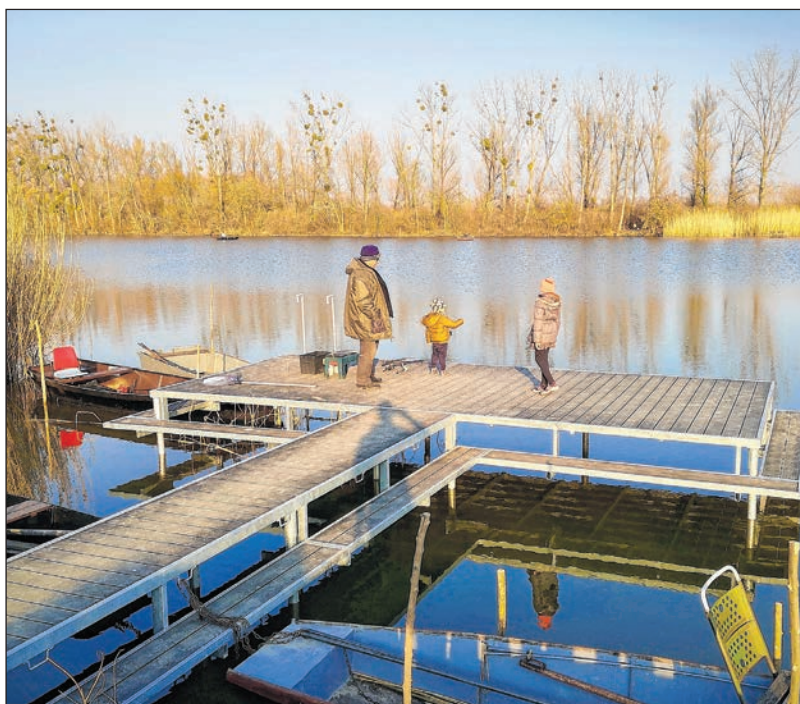
A jelenlegi kikötési igényeket ki tudja elégíteni a korszerű, új móló