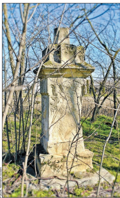
A legenda szerint itt múltak ki a lovak. A hely egykor közlekedési csomópont volt

tam fiatal agronómusként, hogy azelőtt, a régi világban az alföldi marhacsordák nagy része Tolnánál kelt át a Dunán. Itt, ezen az úton hajtották őket Fehérvár felé, majd a Móri-árkon át Győrnek, az országhatár irányába. Tolnáról Júlia-major felé tartott az út, hogy Nagydorognál keresztetesse a mai 63-as főutat. Ezt nem csak Tolnán hívták Széles-csapásnak, hanem a megye belsejében is, felváltva hol ennek, hol Fehérvári útnak nevezve. Ennek az útnak az eleje, itt Tolnán, a téesz időben szilárd útburkolatot kapott, ami az egykori téesz szőlő mellett vezetett a téesz pincéhez.