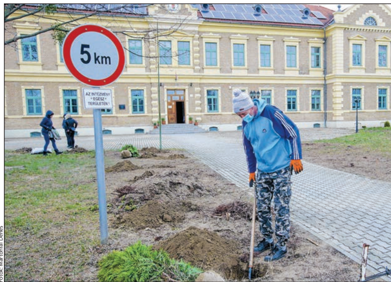
Gömbtujákat ültettek a régi oszloptuják helyett

A nemrég kivágott, negyedszázados oszloptujákkal sok gond volt. Nehezen lehetett rendben tartani a területet, már el is öregedtek, féltől, hogy hamarosan elpusztulnak. Ezért döntöttek úgy, hogy olyan fajtára cserélik, amely nem nő ilyen magasra, és látható marad mellette az épület szépsége is. Kertészmérnök javaslata alapján gömbtujákat vásároltak. Emellett szempont, hogy a park más funkciót is kapjon, tervezik a további fásítást – mert nemcsak a díszítés a lényeg, hanem hogy a klíma a meleg napokon elviselhetőbb legyen –, illetve kültéri bútorok elhelyezését, hogy otthonosabbá tegyék az iskola környezetét.