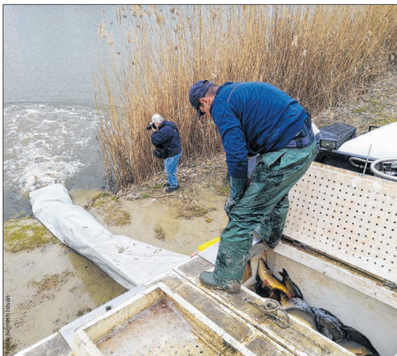
Két kiló átlagtömegű pontyot helyeztek ki