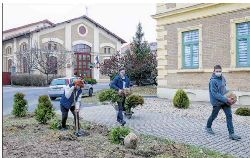
Tanárok és diákok is részt vettek a munkában