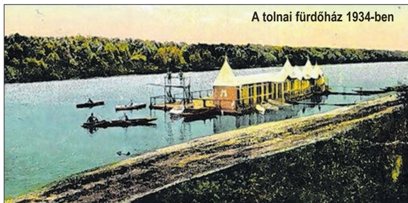
A tolnai fürdőház 1934-ben

terjedelmesebb. És ami innen jön az egy igazi sikertörténet. Egy család felemelkedéséé, amelynek a kezében nem a földbirtok és a pénz, hanem a művelődés és a tudás vált hatalommá.