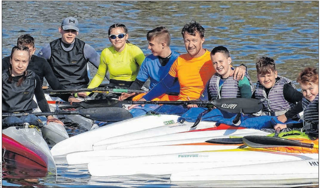
Március végi kajakedzés a tolnai holtágon

Egyben döntött arról, hogy idén is kapnak sportingatlan üzemeltetési támogatást az érintett klubok. A kajakházat üzemeltető Tolnai Kajak-Kenu SE 767 ezer, a városi sportpályát üzemeltető Tolna Városi Futball Club és Szabadidős Társaság 3,1 millió forint támogatást kap 2021-ben erre a célra.