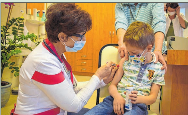
Diftéria, szamárköhögés és tetanusz elleni oltást kap a hatéves kisfiú

A tolnai foltvarrók rendszerint eljárnak táborozni, az utóbbi időben Alsómocsoládra, ahova Pécsről, Mohácsról és Bonyhádról is érkeznek résztvevők. Itt a szép közösségi házban, egy gyönyörű tó mellett tölthetik az időt. Lehetőség szerint májusban rendezik majd idén a táborozást. K.E.