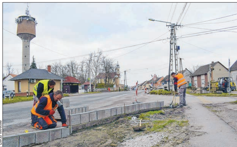
A padkát is rendbe teszik, a szegélyköveket is kicserélik