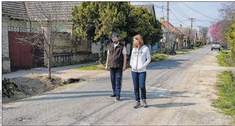
A mözsi Alkotmány utca egy szakasza burkolatának felújítására is pályázik a város