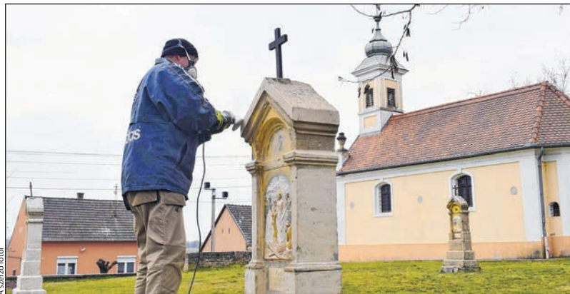
A nagypéntek előtti napokban még dolgoztak a stációkon

A nagypénteki keresztútjárás a szokásos módon zajlott, csak maszkban.