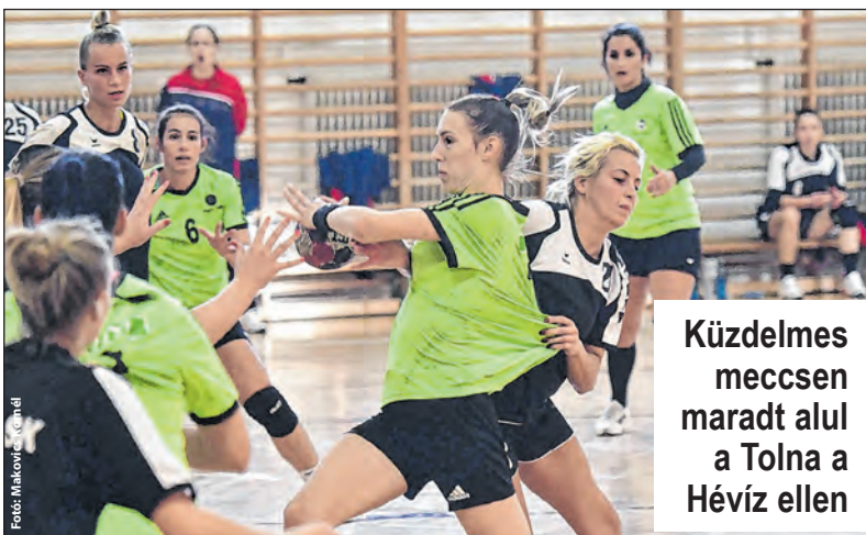
Küzdelmes meccsen maradt alul a Tolna a Hévíz ellen

Január 24-én a Szekszárdi FC csapatához látogat a Tolna-Mözs, így szomszédvári derbivel indul a 2021-es esztendő. A tolnaiak januárban ezen kívül még egy bajnokit játszanak, 30-án Debrecenben, a DEAC csapatával vívnak rangadót.