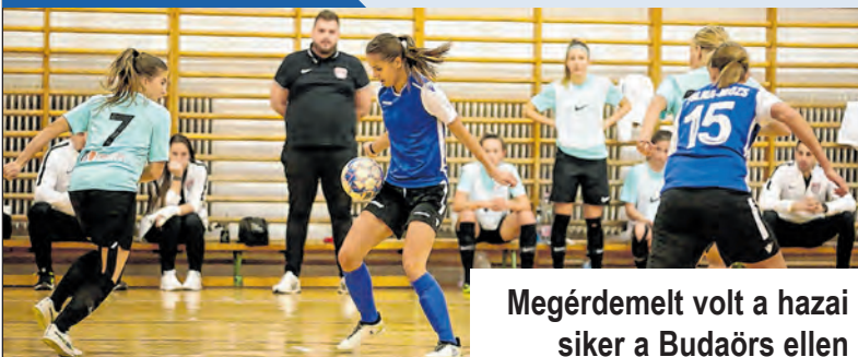
Megérdemelt volt a hazai siker a Budaörs ellen