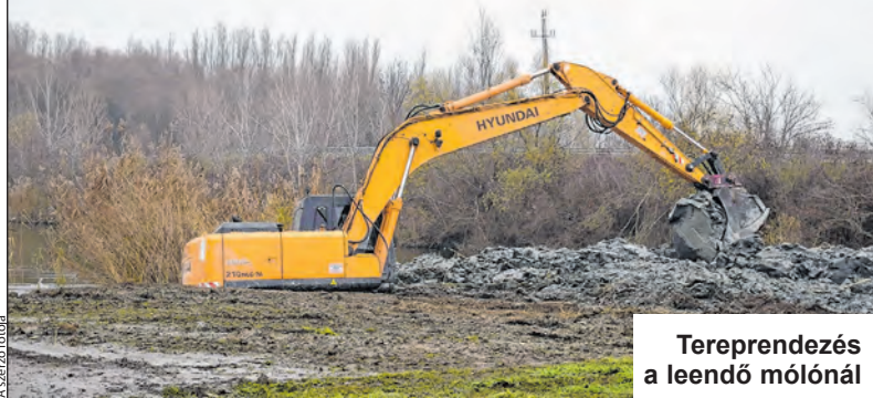
Tereprende- zés a leendő mólónál

Közösségi víziállás, nemcsak horgászoknak