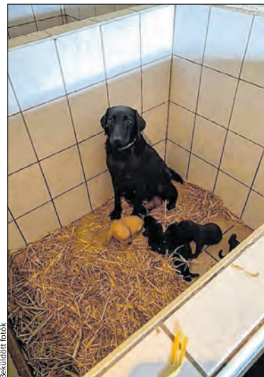
Szaporítás: a Retriever Rescue Fajtamentő Egyesület által mentett labradorok egy vidéki telepről

A tenyésztés egyik alapvető feltétele a tenyészszemle és képességvizsga, majd ehhez kell a kennelnév, a kutyák tenyésztésbe vétele, fedeztetési jegy, alomellenőrzés stb. A szülők orvosi költségei (szűrések), minőségi táppal etetése, vitaminok, külső, belső élősködők elleni védelem biztosítása nem kevés pénzbe kerül. Az a kutya, amelyik számos kiállítást megnyert, bizonyíthatóan magasabb minőséget képvisel fajtáján belül. A jó tenyésztő szerződésel adja a kiskutyát, melyben garanciát vállal az egészségi állapotára is.