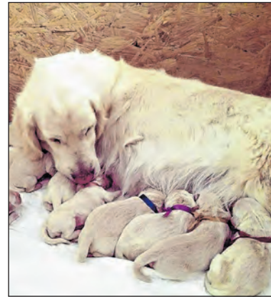
Tenyésztés: Golden von Schwarz kennelel, F alom

könyv a drága, hanem ami mögötte van. Ahhoz, hogy egy kölyöknek származási lapja legyen, az ősöknek is számos dolgot kellett teljesíteni.