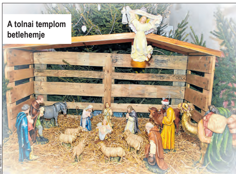
A tolnai templom betlehemje