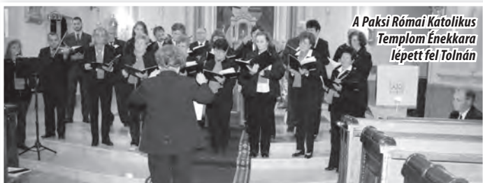
A Paksi Római Katolikus Templom Énekkara lépett fel Tolnában

Hangverseny, szentmise, szeretetvendégség, elmélkedés