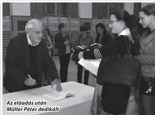
Az előadás után Müller Péter dedikált

nak, mert eddig megfosztották attól, hogy öntudatra ébredjen. II. János Pál pápát reformernek tartja, aki felismerte, hol van a nők valódi helye. Szavait idézve azt mondta: „az emberiséget megfosztotta az igazi lelki gazdagságtól” az, hogy a nők rabszolgasorba kényszerültek. Isten segítő társnak rendelte a nőt a férfi mellé. Segíteni pedig csak úgy tud neki, ha egy szinten áll vele. Napjainkban a nők egyre függetlenebbek, szabadabbak. Ezt nehéz a férfiak elfogadni, mert már nem ura asszonyának, a nő tényleg a fele-sége, a társa. Szuverén ember, aki- nek ugyanolyan méltósága van, mint a férfinak. Az uralom eredeti értelme, hogy szolgálom őt.