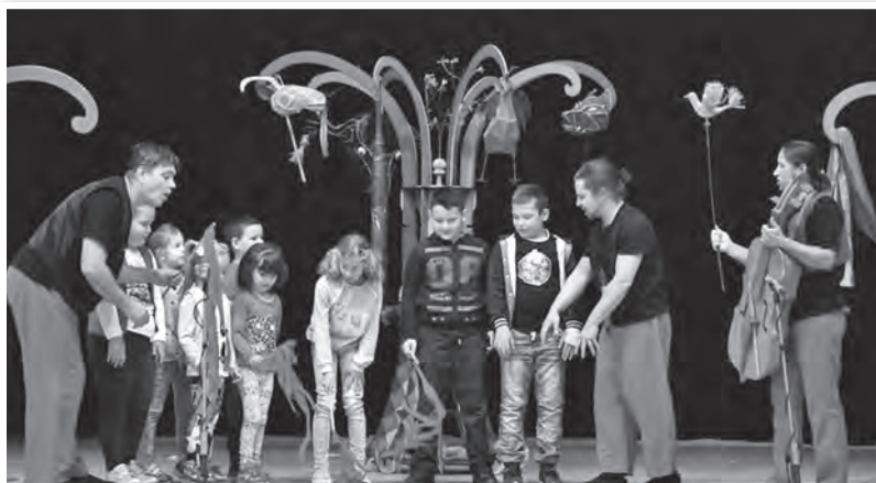
Az előadásba a közönséget is bevonták a színjátszók

Villámgyors nyelvtörőekkel jelent meg a bika: „fekete bikapata kopog a patika pepita kővén”. Majd táncal jött a Bunkó, és a nevével jelzett viselkedésről kezdett beszélni. A gyerekek pedig sorolták, milyen magatartásra mondhatjuk meg, hogy bunkó. Aztán a kismadár a férgecskéhez fordult, aki szintén nem segített neki, amíg fel nem ajánlotta őt a kiskakasnak eddelül.