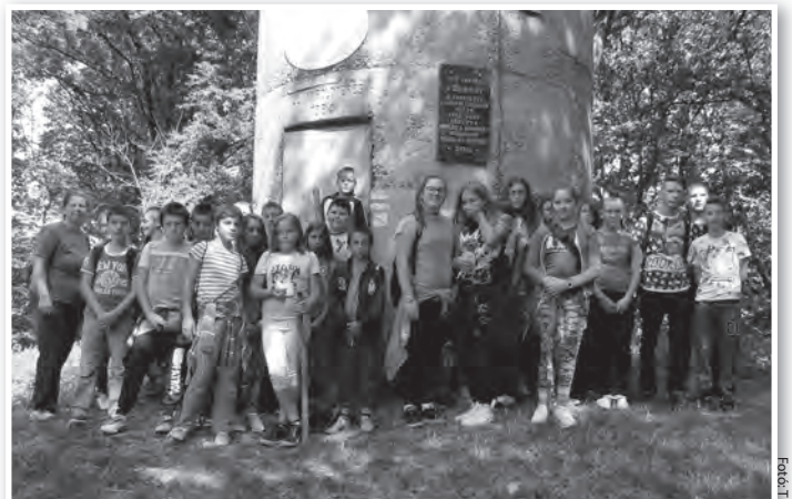
Pihenő a zengői kilátónál

ban megismerje egymást, más oldalról is, mint amire a szoros iskolai kereteken belül lehetőség nyílik. Ez a néhány nap jó alkalom ahhoz is, hogy a résztvevők igazi segítő közösséggé kövacsolódjanak. Az erdei iskola megvalósításában nagy segítséget jelentett a fenntartó Pécsi Egyházmegye támogatása, illetve a Tolnai Római Katolikus Plébánia Karitász csoportjának élelmiszeradománya.