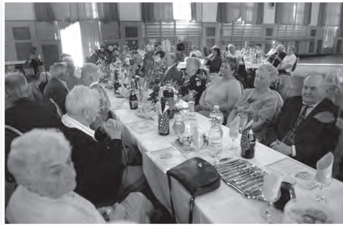
A jubileumi ünnepség résztvevőinek egy csoportja

A nyugdíjas szabadidő klub harminc éve alakult, negyvenegy taggal. Ma nagyjából nyolcvanfős a tagság, köztük vannak alapító tagok is. A klub az egyik legaktívabb tolnai civil szervezet, sokat kirándulnak, előadásokat szerveznek, évtizedek óta ők rendezik az augusztus 20-i városi aratófelvonulást, emel-