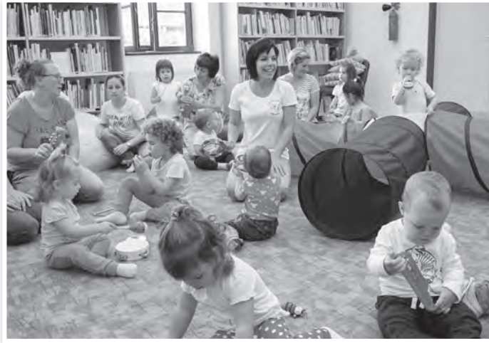
„Ez a csuda zenekar cincog, nyávog”

Maga a foglalkozás egy két részből álló, nagyjából 50 perces program. Az első húsz percben főként ölbeli játékok (simogatók, lovagoltatók) szerepelnek a palettán, népi mondókákkal fűszerezve. A program második felében pedig jön a