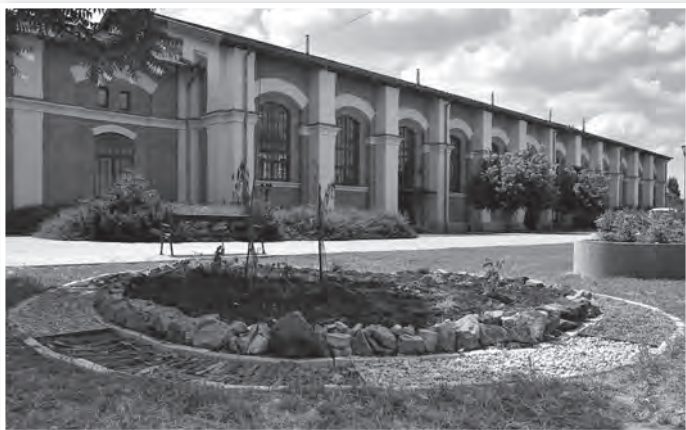
Egyfajta talpmasszázs is biztosít a Kneipp-ösvényen való séta