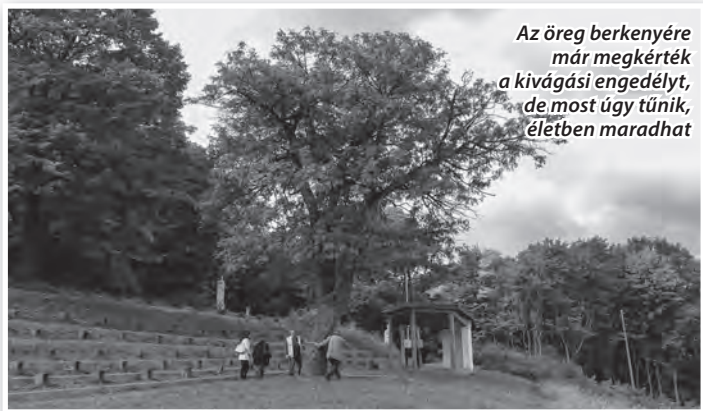
Az öreg berkenyére már megkérték a kivágási engedélyt, de most úgy tűnik, életben maradhat

A házi berkenye ( Sorbus domestica ) ismert gyümölcse volt a magyarságnak, amit azok az eredményesebben nemesíthető körték és almák szorítottak ki kertjeinkből, amik idővel nem csak nagyobbak és szebbek lettek, hanem tárolni is lehetett a termésüket. A berkenye ugyanis csak „szotyósan”, vagyis megpuhultan élvezhető. Termése kisebb körtére, vagy almára emlékeztet, amelyek sárga alapon piros cirmosra színesednek éretten. Tudnivaló még róla, hogy a honi fák közül a legkeményebb a fája, amiből elnyúlhatatlan puszkatus, malomkereket összefogó faszeg, sőt, szőlőprérsó is készült valaha. Semmihez sem hasonlítható, különleges aromájú pálinkáját pedig méltán nevezték a királyok italának.