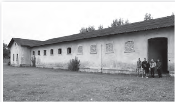
A laktanyában a volt istállóépületből játszóházat alakítanak ki. Ez az utolsó felújítatlan önkormányzati épület a laktanyában

Ez volt az utolsóként elbíralt sikeres tolnai TOP-projekt. A város mintegy 300 millió forint uniós támogatást nyert el az egykori laktanyai istállóépületben kialakítandó játszóház létrehozására. A hajdani istálló az utolsó olyan önkormányzati tulajdonú épület a laktanyában, amelyet még nem újíttak fel. A mostani beruházás nyomán az ingatlan külső arculata nem változik lényegesen. A mintegy 600 négyzetméteres épületben egy klasszikus játszóház kap helyet, beépí-