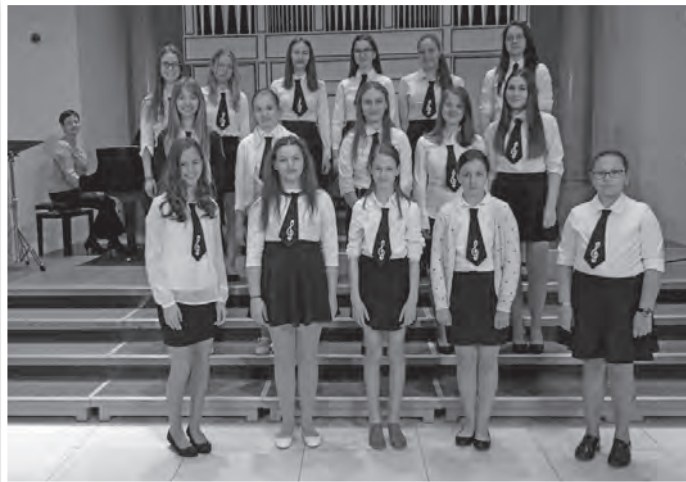
Most is volt okuk a mosolyra a lányoknak