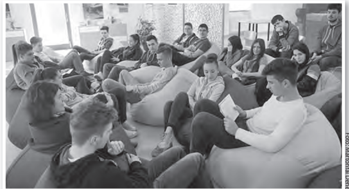
Gimnazisták is részt vettek a versmaratonon

A költészet napja – és az Arany János-émlékév – tiszteletére rendezett tolnai program során további rendezvények is zajlottak a kulturális központban. Délelőtt a lovardában a budapesti Neveincs Színház előadásában közel háromszáz általános iskolás nézte meg a Toldit. Este a felnőtteket várták, szintén a lovardában, amelynek színpadán a fővárosi Körúti Színház előadásorozatának utolsó darabját, az Én és a kisöcsém című, nagy közönségsikert aratott produkcióját élvezhette a publikum.