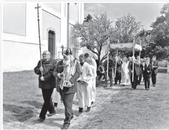
A húsvét vasárnapi feltámadási körmenet

nyaival való első találkozására emlékezik. Ez a német óhazából hozott ősi népszokás, amit sok dél-dunántúli németajkú településen gyakoroltak hajdan, a második világháborúval és a kitelepítéssel csaknem teljesen elhalt. Bólyban