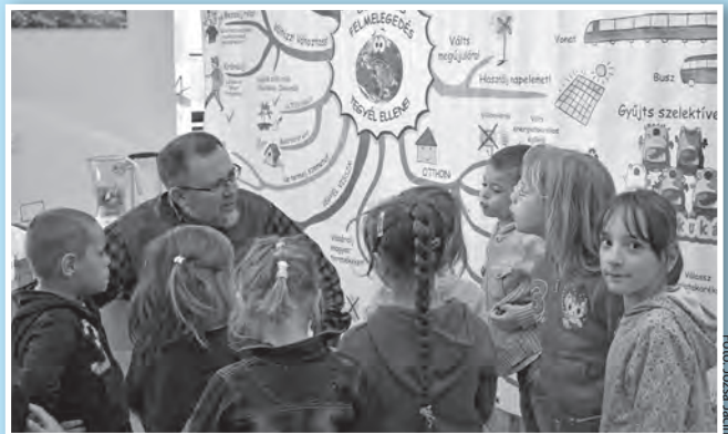
Fotó: Józsa Jácint

Változatos program a Föld napja alkalmából