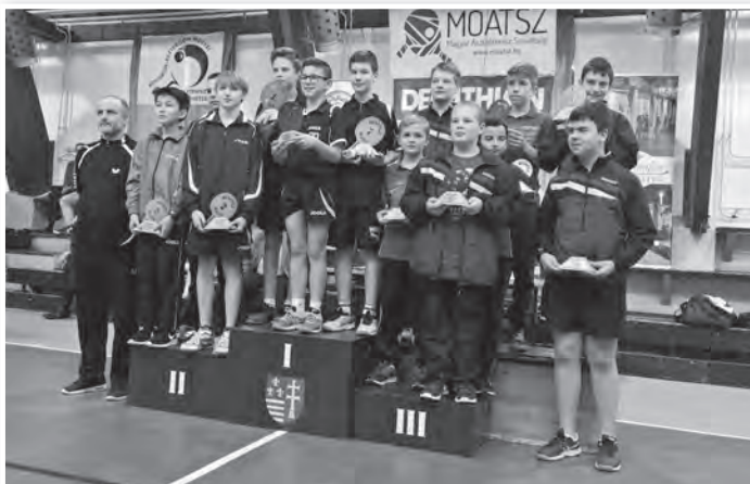
Tatán a dobogó harmadik fokára állhattak fel a tolnai fiúk