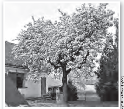
Még száz év felett is „menyasszonyi” díszbe öltözik a kőrtefa

Hogy mi tudható még meg a Kálmán körtéről? Érdemes fellapozni a szakirodalmat, amiből kiderül, hogy az egyik legősibb nemes kőrtefajtánk, amit még a törökök hozhattak be Dél-Anatóliából. Nevének nincs köze a Kálmán személynévhez, ebben is a török múltat, az ottani Karamen tartomány nevét őrzi. Kiveszőfélben lévő hagyományos fajta, amelyből áru gyümölcsös mára jó, ha egy hektáryi akad az országban. De a régi kertekben, egykori paraszt portákon még itt-ott fellelhető. Betegségeknek ellenálló, igen hosszú életű. Az egyik legöregebb honi példánya egy Balatonalmádban élő 350 éveses becsült fa. A lomb körmérete eléri a 14 (!) métert, és még ma is évente 8-10 mázsa körtét terem. Koránál fogva már legendák