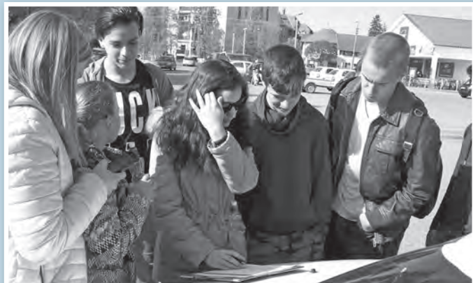
A győztes csapat a zeneiskola épülete melletti állomásnál

Mór sírjának megtalálása, vstanulás, „kincskeresés” a Duna-parton, Tolna-történeti totó és sok egyéb, a város történetével, épületeivel, emléktábláival összefüggő feladat is. A csapatok a tolnai diáktúrának és vidámságnak megfelelő neveket választottak maguknak. A győztes a 9. a. osztály „Népművészeti cserépedények” nevet viselő csapata lett. Jutalmul egy pécsi kiránduláson vehetnek részt. L.J.