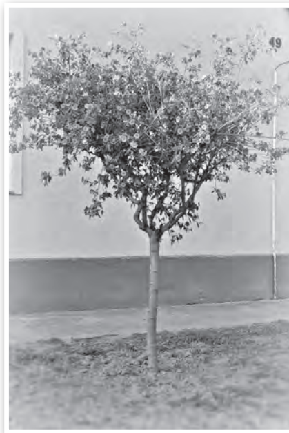
Az enciánfa a burgonyával is rokonságban áll

– Mi csak karácsony óta lakunk ebben a házban, amelyben előtte a nagyanyám élt. Ő jelenleg a tolnai szociális otthon lakója, vagyis ahogy a ház, úgy ez a kis fa is az övé volt. Ő nevelgette, pátyolgatta idáig, nyaranta az udvarban volt, télen a folyosón telet. Mi ültettük ki az utcára először. Hogy mit kell tudni róla? Azt, hogy egy kimon-