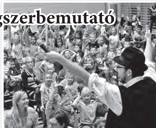
Ennyire élvezték a vásári komédiát

rült, ma is készíthetünk hangszert olyan tárgyakból, amelyeket a környezetünkben találunk, akár egy papírkéztörő gurigájából is. A gyerekek jó hangulatban búcsúztak el egymástól egy dalocska éneklésével: „Aki ma még apró, holnapután nagy lesz...” A bemutató zárásaként mindenki megnézhetette a hangszereket, és kérdezhetett róluk.