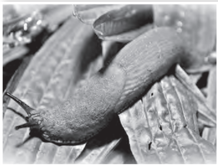
A mindent elfogyasztó meztelen csiga

Ezek közül is a legkártékonyabbnak tűnik a spanyol meztelen csiga ( Arion lusitanicus ). Ezt ma Európa száz legveszélyesebb kártevője közt tartják számon. Mindent megeszik. Még a többi állat által messze elkerült bűdöske nevű virágot is elfogyasztja pár óra alatt, ha az útjába kerül. 12-15 cm hosszú, vagyis a mi honi házatlan csi-