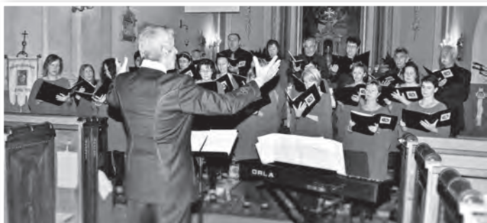
Emlékeztető hangversenyt adott a Gagliarda Kamarakórus