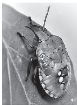
A vándorpoloskának nincs természetes ellensége

Az idei nyár negatív szenzációja e sorban a zöld vándorpoloska ( Nezara viridula ) inváziója volt, amely Tolna környékét is elérte. Ez egy Etiópiából származó „migráns”, amelyről pár éve már tudnak a szakemberek, de ijesztő felszaporodása csak mostanság lett szembetűnő. A kb. 10 mm nagyságú, kifejezetten zöld „címerpajzsot” hordozó poloskafaj fedőszárnyán 5 pont található, amelyből a szélsők feketék, a belsők fehérek. Ez is mindenevő. E sorok írójának főlíasiátrában a hajatattott paradicsomot és paprikát lepték el, ami azelőtt még soha nem volt rovarölő szerrel permetezve. Hogy eztán lesz-e? Vagy itt a vége az otthoni főlíasiásnak? Még nincs eldöntve. Védekezni mindenesetre lehet ellene, a legtöbb engedélyezett rovarirtó szer elviszi (egyelőre), ha vigyázunk a szerrotációra. Természetes ellensége sajnos nincs, mivel a bűzmirigyében tárolt váladék miatt a legtöbb rovarfogyasztó állat undorral fordul el tőle.