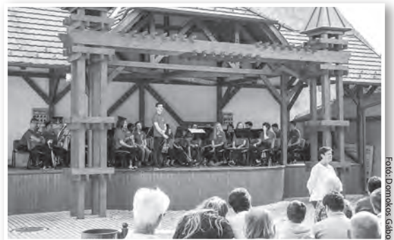
Elsőként a Tolnai Ifjúsági Fúvószenekar szolgáltatta a Herbstmusikot Mözsön