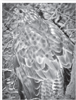
A sérült egerészölyv

Szeptember 15-én délután négy óra körül megcsörrent a telefonom. Egy jó ismerősöm hívott, akiknek Tolna-szigeten, az egykori Knefely kastély közelében van egy kis bekerített telke. Itt dolgoztattak édesanyjával és a hűgával, amikor a kertjükbe esett egy sérültnek látzó nagy ragadozó madár. – Mit lehet vele tenni? – fordultak hozzám tanácsért. Én sajnos nem segíthetek – volt a válaszom – de ismerem olyat, aki jártasabb az ilyen ügyekben. Telefon ment és