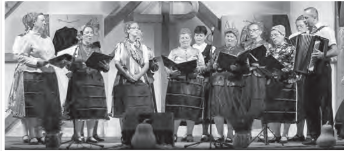
A műsor zárásaként a jubiláló klub kórusa énekelt

zetes napokat töltött ezzel a fiatalos, vidám társasággal, akik az Év Tolna megyei civil szervezete