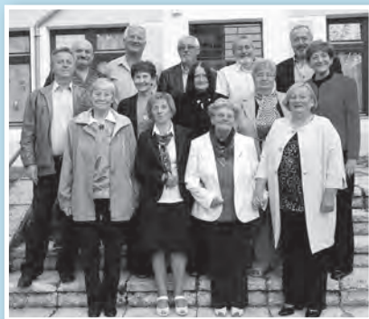
Tizenkét mözsi öregdiák és két tanárú jött el a találkozóra

Záróakor, közel az éjfélhez köszöntek el egymástól: öt év múlva veletek, uyanitt.