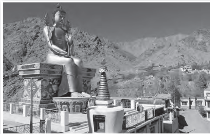
Lekir nyolc méteres aranyozott Buddha-szobra

Nagy élményt jelentett, hogy a Diskit-i kolostorban szemtanú lehetünk a cham-nak, ennek a nem mindennapi látványosságnak. A cham a szerzetesek által előadott színpompás, maszkos táncok sorozata, amivel vallási történeteket mesélnek el, a jó gonosz feletti győzelméről. Voltunk tibeti lakodalomban is, ahol a mennyasszony tükür-