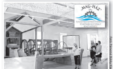
A MAG-Házban egy működőképes hajómalom is helyet kapott