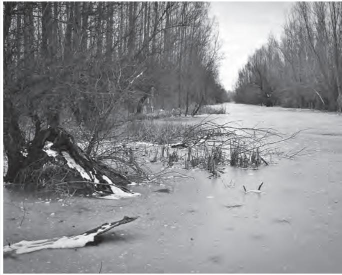
A gyönyörű tolnai holtágak a halakon kívül is számos értéket hordoznak, télen és nyáron egyaránt

Mint az ismert, a Déli-holtág hasznosításáról már korábban megszületett a határozat. Ezt a vizet 2013 óta a Tolnai Dunáért Egyesület kezelte. A képviselők