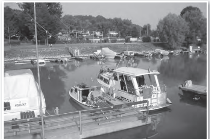
Kikötöttek a tolnai hajók

Hogy hány tolnai hajós járt valaha ezen a vizen? Megszámálhatatlan. Most, hogy mára én is beállhattam mögéjük e sorba, egyfajta elégtétellel tölt el. Jó közeliük tartozni. Megérni, hogy ehhez is felnöhettem. ká