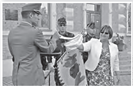
Május végén hazalátogatott a tüzérek csapatzászlaja

MÁJUS: Egy napra „hazalátogatott” a hajdani 12-es Tolnai Tüzér Osztály 1942-ben felavatott, sokáig Amerikában őrzött, felújított zászlaja. A látványos, katonai külsőségek mellett lezajlott ünnepséget a Sztárai gimnázium udvarán ren-