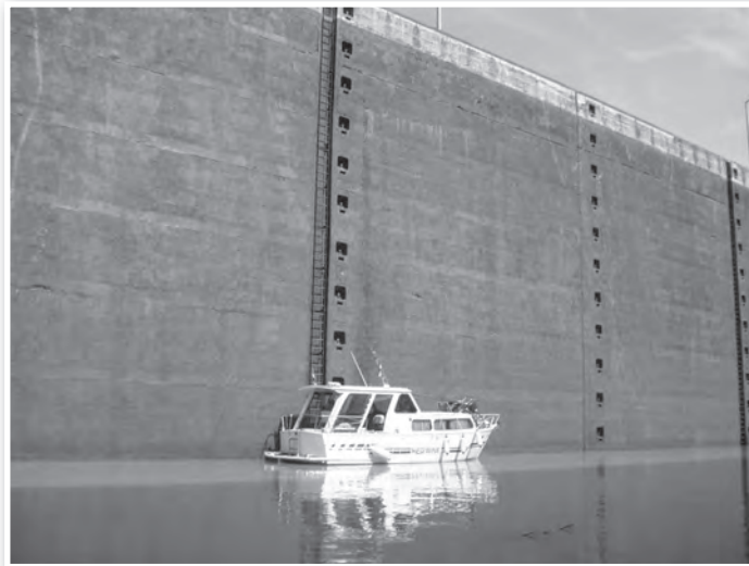
A Red Wine zsilipelés közben

Kegyesek voltak hozzánk az égiek, egész utunk alatt egy csepp eső sem esett. Az út során két dolog nyugtázza le az embert. Az egyik a technika nagyszerűsége, 13