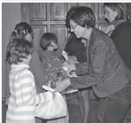
Ajándéksomagok osztása a Lovardában

munkatársait, aktivistáit is dicséret illeti az önzetlen, önkéntes munkáért. Ugyancsak sokat tettek a jó ügyért a Wosinsky iskolások. Negyvenhat harmadikos tanuló és hat felkészítő tanár rengeteg időt szánt arra, hogy színpadra állíthasson egy igen nívós karácsonyi