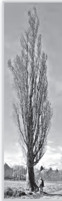
Az utolsó öreg jegenye a Palén

Fiatalabb jegenyénk is van pár. Egy tolnai baráti kör két éve ültetett egyet a 6-os úti fa helyére, egy szett példány áll a volt Stern-telep mögött, a HTSZ telephelyén, fiatal jegenyék nézik a forgalmat a Gutay-kastély és a Dombori út között, két serdülő jegenye pedig a műzsi tévészroda mögött ágaskodik. ká