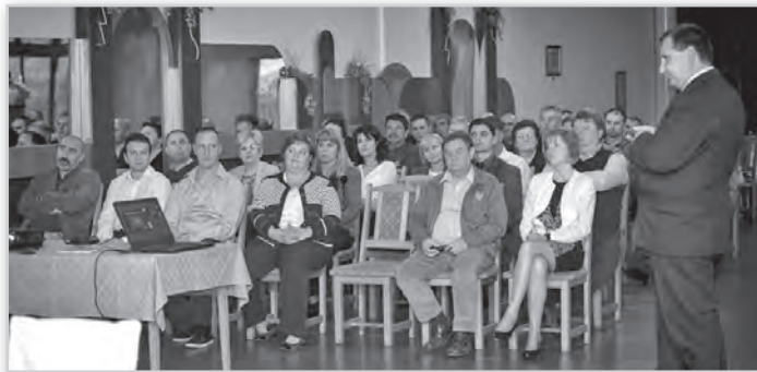
A fórumon a város vezetői és huszonhat vállalkozás képviselői vettek részt

A vállalkozói fórumon elhangzott: 2014-ben saját forrásból 88 millió forint értékű beruházás valósult meg Tolnában, míg pályázati forrás segítségével 2,5 milliárdnyi. Idén – a források függvényében – három utcában terveznek útépitést, illetve felújítást. Folytatnák a városközponti járdafelújítást is. Folyamatban van a zeneiskola épületének tetőfelújítása, tervben a tolnai és a mözsi ravatalozók életetelővel való ellátása. Három közintézményre napelemeket helyeznek el, kész tervekkel várják a közvilágítás korszerűsítésével kapcsolatos pályázat megjelenését. Tervben van a városi sportcsarnok és a mözsi Zöldkert óvoda fűtőkorszerűsítése, illetve a Garay utcai, az Alkotmány utcai és a mözsi orvosi rendelők felújítása. Két nagyprojektet is várhatóan átadnak idén: önkormányzati hozzájárulást igénylő állami beruházásban elkészülhet a tanuszoda. A kivitelezés kezdetéről és egyéb részletekről azonban jelenleg a városvezetésnek is alig van információja. Az önkormányzati beru-