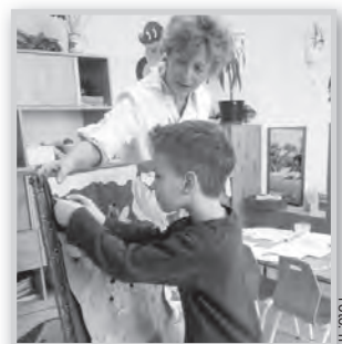
Játékos feladatokkal adtak számot tudásukról

A Selyem Óvoda idén is megszervezte a már hagyományosnak mondható „Madaras vetélkedőt” a nagycsoportosok számára. A gyermekek játékos feladatokat megoldásával felelevenítették, összefoglalták az eddig végzett madármegfigyelések, madáretetés, beszélgetések során szerzett ismereteiket, számot adtak tudásukról. A feladatok játékosan vezették rá a gyermekeket arra, miért fontos gondozni az állatokat. Idén 24 lelkes „madárbarát” gyermek vehette át a sok-sok tudásért járó oklevelet.