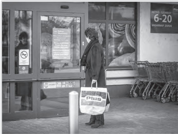
Sokan az üzlet ajtajában döbentek rá vasárnap, hogy zárva van

A kereskedelmi szektort érintő, a vasárnapi munkavégzés tilalmáról szóló jogszabály kapcsán számos pro és kontra érv elhangzott. A