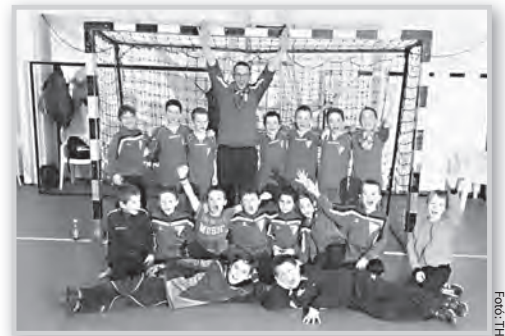
A Tolna VFC győztes U-9-es fiúscapata

A Tolna-Mözs Futsal SE által rendezett IX. Jako Tolnai Futsal Napok márciusi küzdelem-sorozatán 60 csapat 585 játékosa lépett pályára. A háromnapos futsalfesztát a szabadkaiak részvétele avatta nemzetközivé. A házigazda Tolna-Mözs Futsal SE csapata a 11 a 15 és a 17 éves