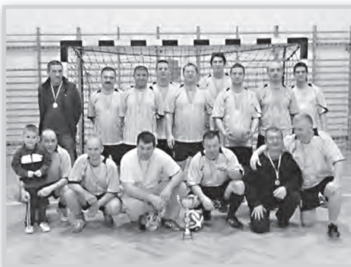
A B-liga bajnoka, a Csel-szi csapata

A B-csoportban is befejeződött az Alta Ripa teremlabdarúgó torna. Végeredmény: 1. Csel-szi 37, 2. Izomix 35, 3. Sárvíz Autóúveg 35, 4. OLC Bróker 30, 5. Gernik 27, 6. Bori-COO 25, 7. All-In 24, 8. Rózsaszín Párduc 10, 9. Zsványok 7, 10. VFC ifi 3 ponttal. Góllövőlista: 1. Tóth Attila (Sárvíz Autóúveg) 31, 2. Drészer László (Izomix) 27, 3. Jóföldi Tamás (All In) 25 ponttal. A legsportszerűbb csapat: Zsványok.