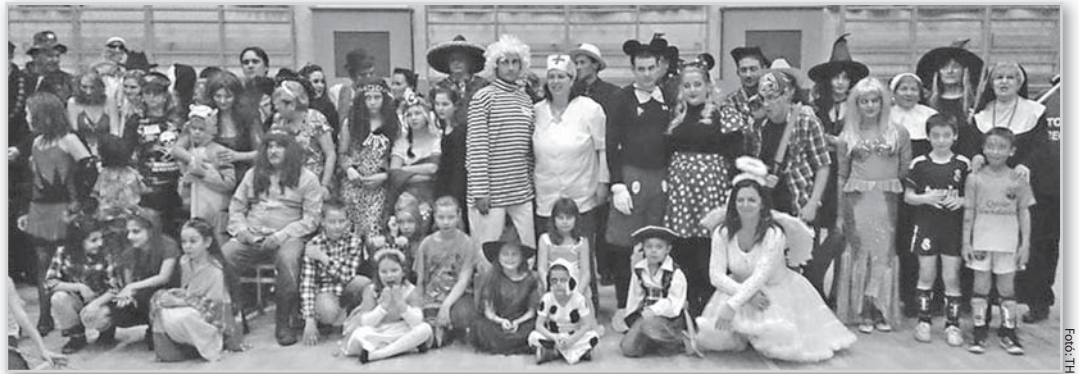
Látványos volt az idei nagycsaládos farsang is

jön a Mikulás, akinek köszöntésére mindig látványos műsorral készül az egyesület. Az előadás után pedig mindenki elkíséri az öreg nagyszakállút a város ünnepi díszbe öltözött főterére, az adventi hétvége programjaira. Szervezünk még