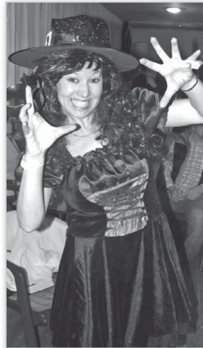
Mindenki szeret örülni látszani ilyenkor

Aztán elindul a Másképp (fellépő zenekar I.), lóhalálában csapnak a húrokba. A négy fiú éneke mindig lenyűgöz, négy teljesen más hang egyszerre megszólalva kellemes borzongást tud okozni, mint ahogy a meghívottként először fellépő lány hangja is. Még kevesen táncol-