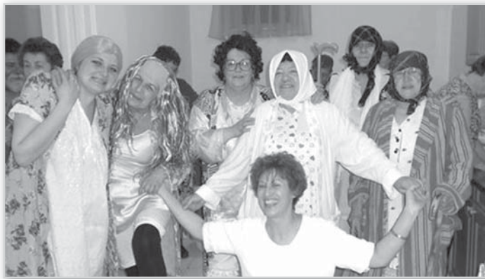
Vacsora utáni vidámság

Hogy megéri-e pár szál kolbászért, hurkáért és egy esti vacsoráért egész nap dolgozni? Kívülállóként egész biztosan nem. E hagyományápolás azonban nem csak az evést szolgálja. Hozzá tartozik az a milió és hangulat is, amit e nélkül lehetetlen megteremteni. A vacsora utáni móka, vidámság és nóta, ami az akkori ember „na, éhen talán már nem halunk jövőre sem” optimizmusából fakadt, mára felelőset egy másik fontos dolgot is, az összetartozás érzését. Mert az összes emberi csoportosulás, a várostól, az utcán át a családig, olyan e rendező elv nélkül, mint a molekulák laza halmaza a légtérben, amit csak a meghatározó kristályszerkezet tesz használható anyaggá. Vagyis, esetünkben, élhető emberi közösséggé. Ká