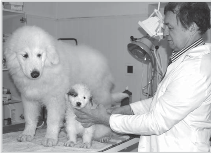
A chip beültetése a kutyának semmilyen egészségügyi problémát nem okoz

Még egy érv a chip mellett, hogy balesetkor szintén lehet azonosítá-