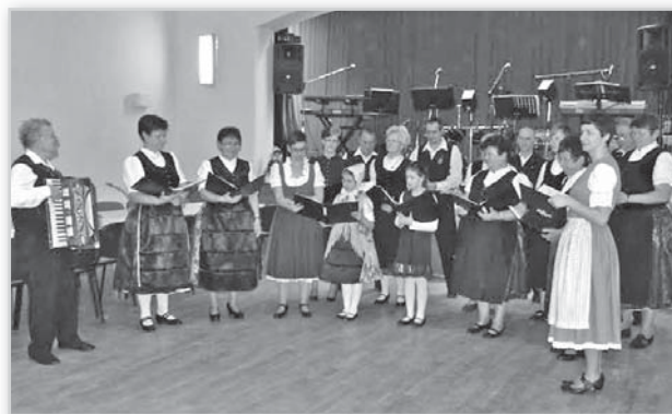
A német klub énekkara is fellépett

A vémei Sextett Zenekar a Mözsi Művelődési Ház bejárata előtt hangos zeneszóval adta mindenki tudtára, hogy a vigasság a kezdetét vette. A ház falai között a Mözsi Zöldkert Óvoda gyermekeinek vidám műsorával, majd a német klub énekkarának