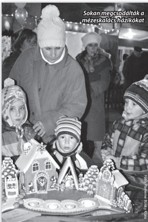
Sokan megcsodálták a mézeskalács házikókat