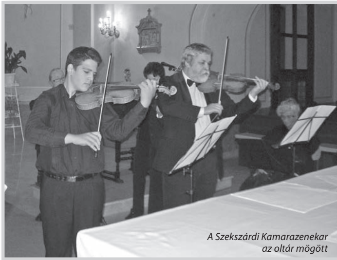
A Szekszárdi Kamarazenekar az oltár mögött

üdvözít. Ezután a saját hibáiról, tévelygéseiről és az azokból való, hit általi szabadulásairól beszélt, melynek során hol a pszichét jól ismerő szakembert, hol pedig a poklokat is megjárt magánembert láthattuk benne. Még sokáig hallgattuk volna – s mint látszott, neki is lett volna még mondandója – ám hogy a többi program se csúszson, rövidre kellett fognia mondandóját, bízva abban, hogy amit itt nem mondhatott el, még elővashatjuk nemrég megjelent, és ide is magával hozott könyvében. Ezután egy ünnepi szentmise