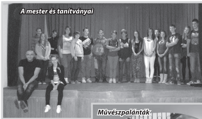
A mester és tanítványai

I tt van az ősz, itt van újra, s ez, mint eddig is, azt jelenti, hogy gyerekszivaj tölti be az iskolákat. Csak néhány hét telt el a tanévből, de a mindennapos tanórák, házi feladatok, tanulás, felelés mellett már eddig is sok programon vehettek részt az iskola diákjai.