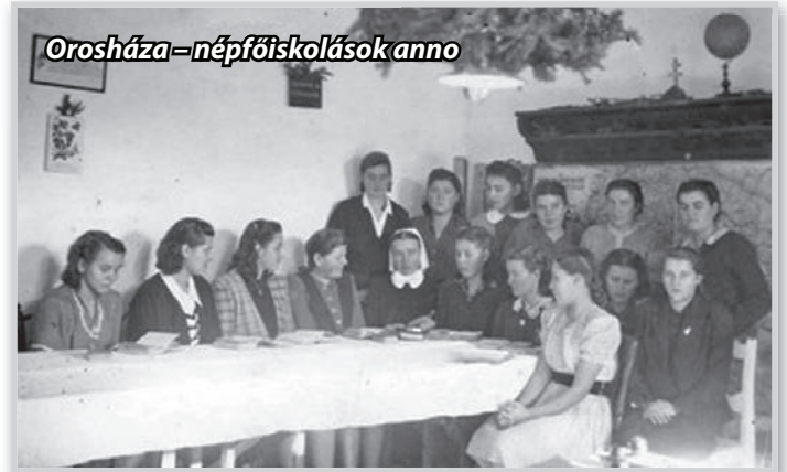
Oroszháza - népfőiskolások anno

teni. Ennek a gyakorlati tudásnak és „újdonságok” bevezetésének érdekében született meg az ötlet. Nikolai Frederick Severin Grundtvig dán evangélikus lelkész terve az volt, hogy a népfőiskola legyen az élet iskolája. Ezt a kezdeményezést fejlesztette tovább Christen Mikkelsen Kolb amikor 1844-ben Roddin-ban létrehozta az első népfőiskolát. A népfőiskolák megalapításának alapelve volt a nemzeti gondolat, a népi hagyományok, az ismeretek megszerzésének szabadsága, a természeti környezet