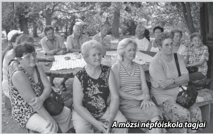
Amözsi népfőiskola tagjai

Az előadások ingyenesek. Minden érdeklődőt szeretettel várunk!