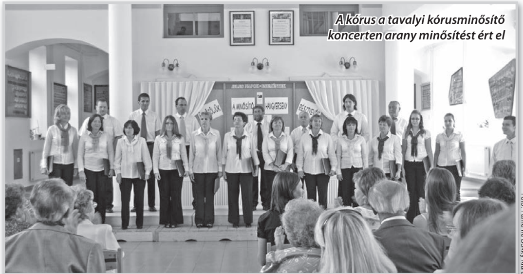
A kórus a tavalyi kórusminősítő koncerten arany minősítést ért el

teszem hozzá, hogy van olyan tagunk, aki itt is, ott is énekel, ami nem ritka a kórusmuzsikát kedvelők körében. Tolna ugyanakkor igazán büszke lehet arra, hogy pezsgő zenei élet van a városban, melyet nem kettő – hanem ha mindenkit összeszámolunk – hat kórusa is bizonyít. Az Ad Libitum kórus