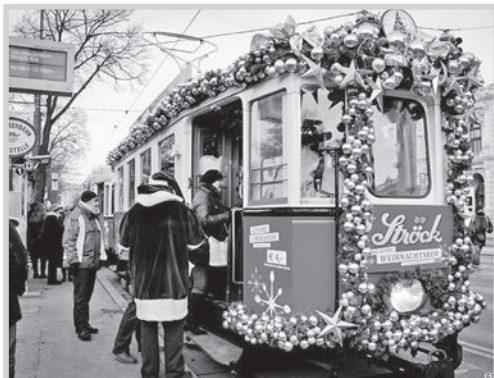
Adventkor még a villamosok is ünneplőbe öltöznek Bécsben

Sétáltunk a belváros legdrágább és legforgalmasabb utcáin. Megnéztük a Stephansdomot. Végül a karácsonyi vásár forgatagában kötöttünk ki. Az idő, mint mindig, most is kevésnek bizonyult erre a programra, de a látvány mindenért kárpótolta bennünket.