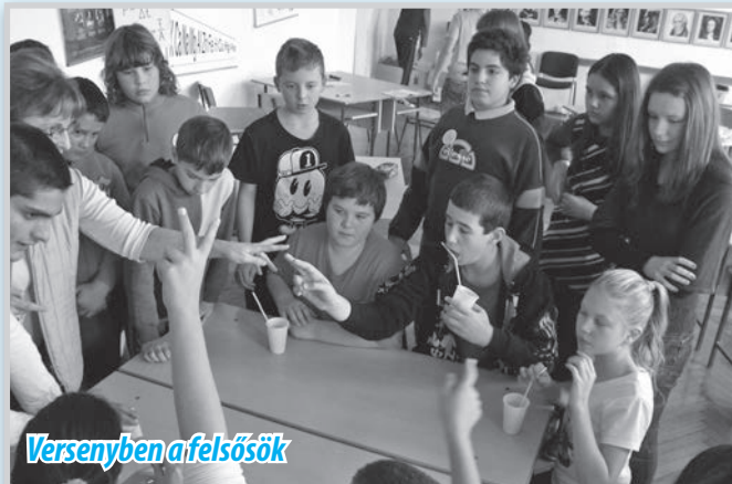
Versenypén a felsősök

ügyességüket. A nap további részében is az egészség kapott kiemelt szerepet: úgymint egészség-vetélkedő, Arcadia-pályázathoz kapcsolódó plakát készítése Marslakócskák és egészséges ételek kóstolójával. Ezúton szeretnénk köszönetet mondani a helyi vállalkozóinknak, akik zöldség-, gyümölcs és müzliszeletekkel biztosították, hogy a gyermekeink egészséges ételeket kóstolhassanak.