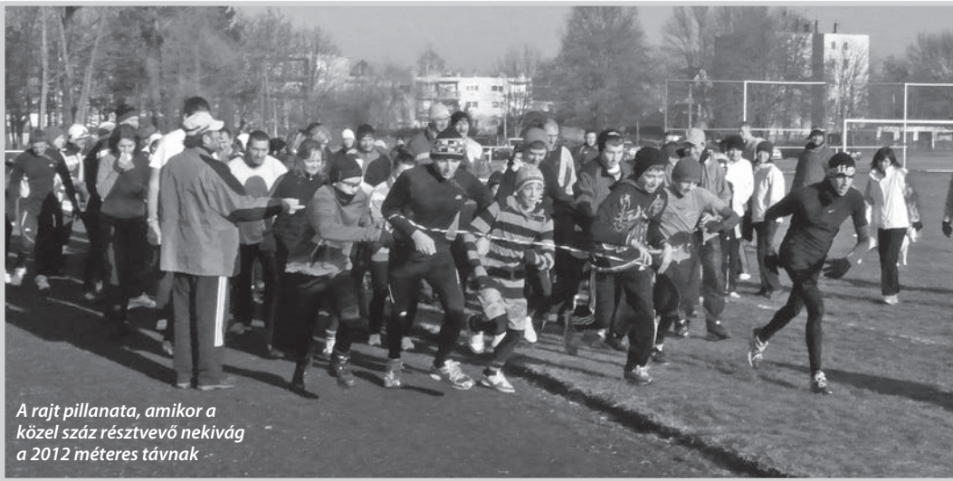
A rajt pillanata, amikor a közel száz résztvevő nekivág a 2012 méteres távnak

Lapunk úgy tudja, egészségük érdekében sokan éltek is a lehetőséggel.