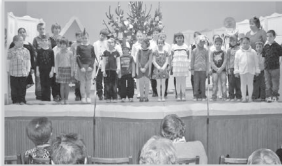
Az idősek otthonának karácsonyán az I. István iskola diákjai már a megújult művelődési házban adták elő műsorukat

mi Kórus által szervezett adventi hangversenyt követő fogadás volt a megszépült intézmény első rendezvénye. A vendégek kíváncsian érdeklődve járták körbe a házat.