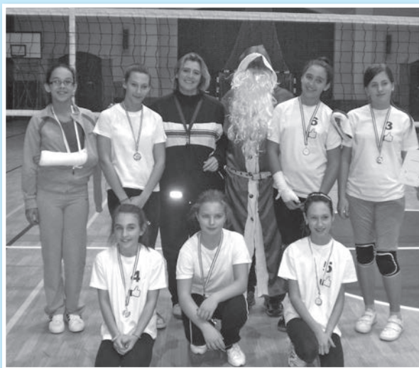
A tolnai BPSZK csapata a Mikulással

Délután: I. Tolna-BPSZK, II. Paks-Deák PRK, III. Paks-Balogh Antal, IV. Kalocsa