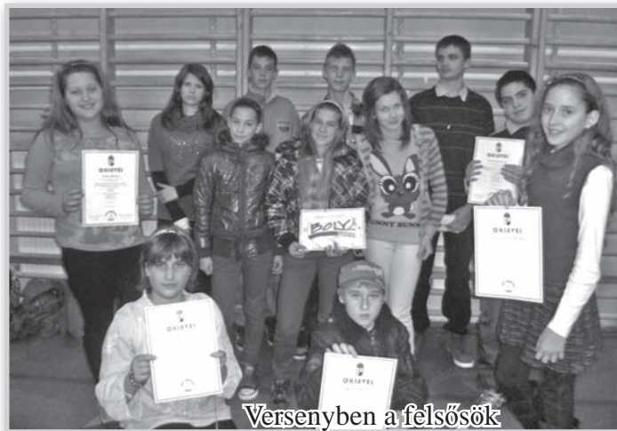
Versenypén a felsősök