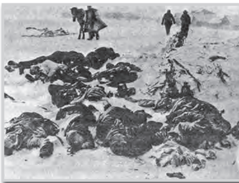
Minden éjszaka legyengült, lerongyolódott magyar katonák ezrei fagytak halálra

– Az utolsó nap majdnem 30 kilométert mentünk. Egy városba érve kaptunk enni meg vizet, aztán indultunk ki, a Donra. Elvittek bennünket egy erdő széléig, de nem voltak hivatásos tisztjeink, hanem falusi tanítók meg jegyzők, és nem tudták, hol vagyunk. Éjszákára bevezettek a brjatszki erdőbe, ott készültünk fel a bevetésre. Azt mondták, felváltani megyünk az előttünk lévő csapatokat, de azokat addigra felmorzsolták, nem harcolt ott már senki. Így rögtön az első vonalba kerültünk. Január 12-én indult a teljes támadás. Harckocsik jöttek ránk, V alakban, mint a vadludak. Nagyon sokan elesetek, megsebesültek, a tüzeireket mind megsemmisítették. A hidegben a lovak is legyengültek, fogatosok nem voltak, a tüzerek ki se tudták vonatni a lövegeket, az mind oda-veszett, mikor visszavonultunk.