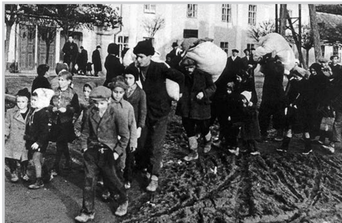
Kényszerkitelepítés elől menekülő felvidéki magyarok érkezése Dunacsúnyba, 1946

E hozzáállás miatt fordulhatott elő az eddig elképzelhetetlen, miszerint több tízezer ember élt hontalanul Európa közepén. A magyar kormánynak ezért nem volt más lehetősége, mint kétoldalú tárgyalásokat kezdeményezni a csehszlovák vezetéssel. A felek 1946. februárjában Budapesten lakosságcsere-egyezményt írtak alá. Ennek értelmében a többségében Békés megyében élő szlovák nemzetiségű, ön-