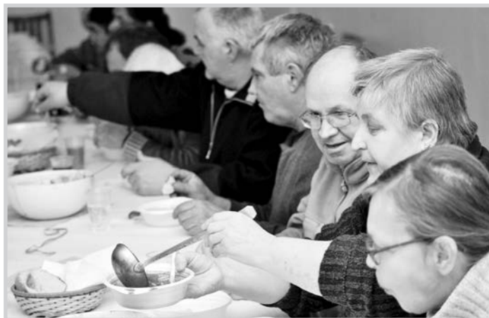
A hangulat, vagy a leves volt-e melegebb?