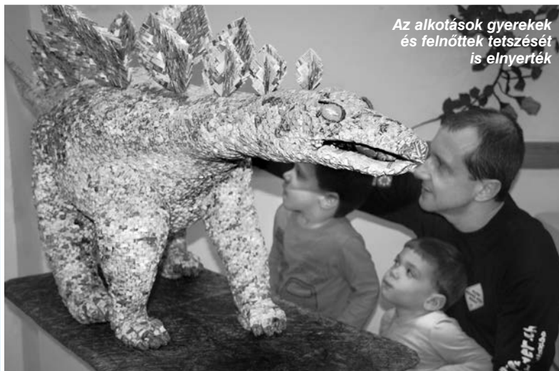
Az alkotások gyerekek és felnőttek tetszését is elnyerték