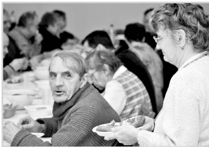
Ez a vacsora tényleg „konkrét” volt.