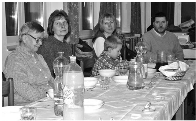
A rendezvény résztvevői