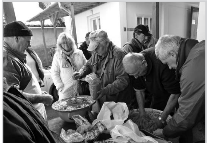
Közös erővel készül a finom töltelék. A kép jobb szélén dr. Sümei Zoltán polgármester

M ég az a szerencse, hogy nem a disznó mondja meg, hogy mikor legyen a disznóvágás, ötlött elém azok után, hogy a helyi német nemzetiségi baráti kör tíz éve ugyanannál a bogyszlói gazdánál, nagyjából ugyanabban az időben vásárolja meg az ünnepi asztalra való ugyanakkora hízóját, amely gyakorlat – ha disznóólak környékén is tudott lenne –, bizonyára okozna némi egyeztetési nehézséget az ott lakozókkal.