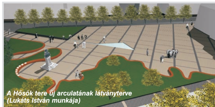
A Hősök tere új arculatának látványterve (Lukáts István munkája)