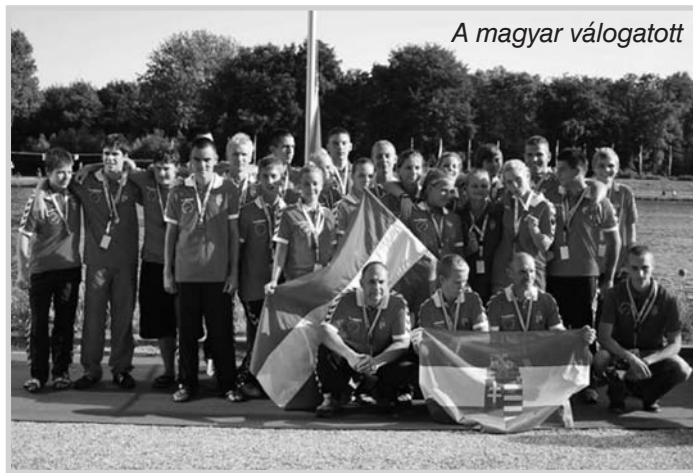
A magyar válogatott

Eredmények: Junior mix: 2000 m: 2. hely, 200 m: 4. hely, 500 m: 4. hely.