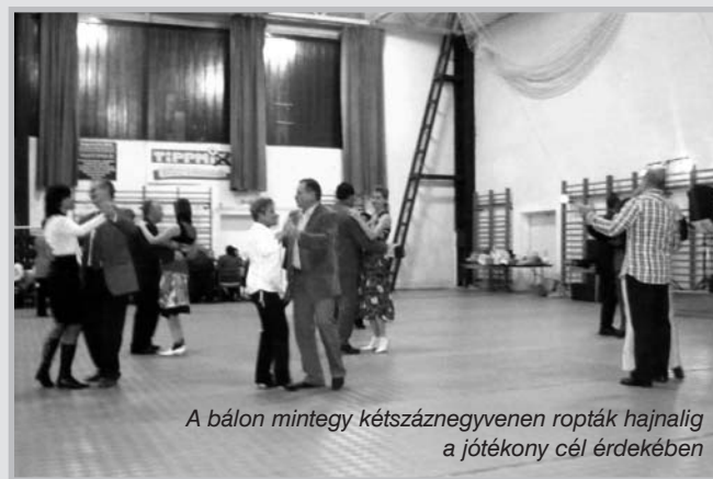
A bálon mintegy kétszáznegyvenen ropták hajnalig a jótekonysági cél érdekében

Az esten az NB I-es csapat szintén műsorral kedveskedett a közönségnek. A legmeghatóbb pillanatokat pedig a kicsik és a nagyok közös produkciója, Máté Péter: „Azért vannak a jó barátok” című gyönyörű dalának eléneklése jelentette. Éjfél után pár perccel tombalorsolás, s a multság hajnalig tartott.