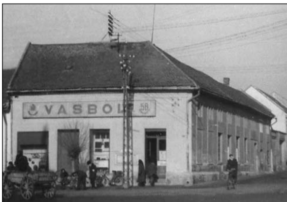
'58-as népbolt Tolnában