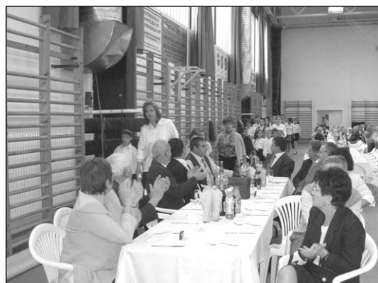
A műsort a Wosinsky Iskola tanulói készítették

A program az Alimentál Kft. által készített és felszolgált szarvaspörköltös estebéddel zárult.