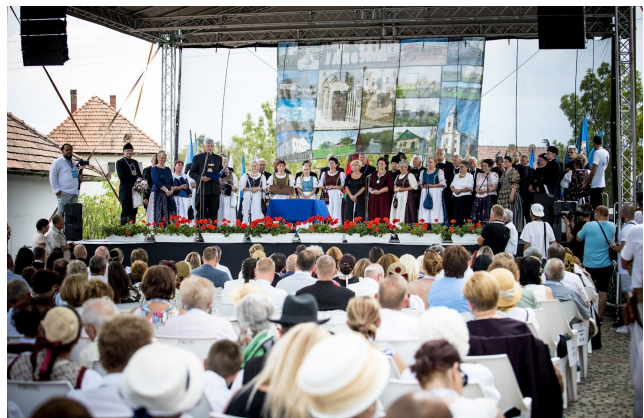
A záróünnepségen az új jászkapitány átadta a stafétát Jászdózsa polgármesterének (lent)