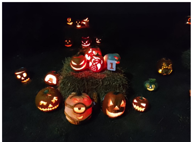
Október 18-án Töklámpás parádét tartottak az óvodában. Az iskolások által faragott tököket az iskola épülete előtt lehetett megtekinteni.