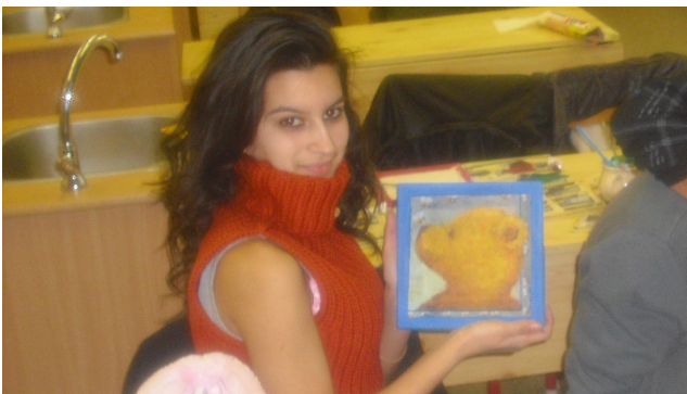
Az ajándék értékét a ráfordított idő mutatja.