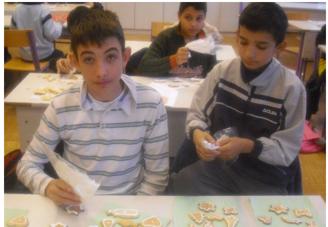
A mézes süti illata már a karácsonyt idézi.