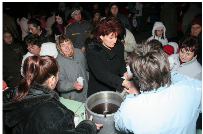
A Mikulás a gyerekeknek, a forralt bort és kalácsot osztók pedig a felnőtteknek szereztek örömet.