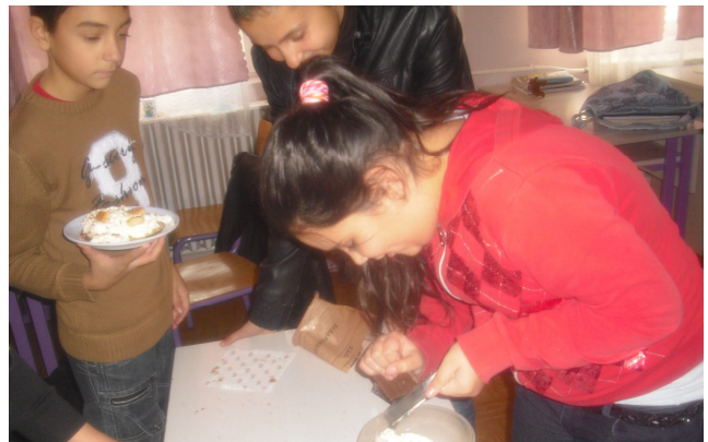
Ezt a receptet otthon is érdemes kipróbálni!