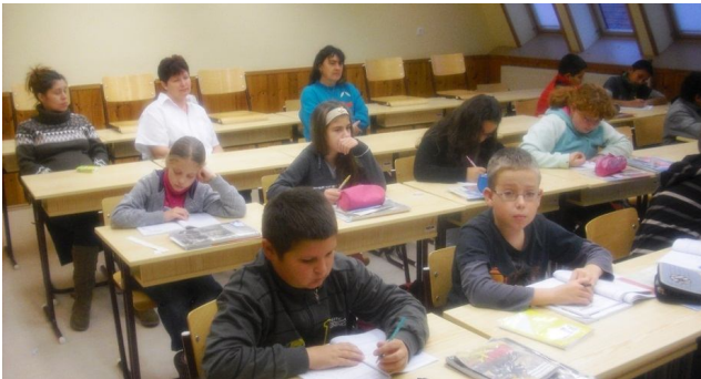
Egy ötödikes tanuló anyukája

Az általános iskolában, mint minden évben, nyílt tanítási órákat tartottak a pedagógusok. Én mint gyakorló szülő vehettem részt, és pillanthattam be az iskola oktatási rendszerébe. Tapasztalatom néhány gondolatban: Változatos módszerekkel, differenciált tanítás-tanulás, figyelemfenntartó feladatok. A pedagógusok türelme, arra való törekvésük, hogy minden gyermek aktív részese legyen a tanórának. Az iskola lehetőséget ad a tanórán kívüli gyakorlásra is, amely elősegíti a gyermekek tanulását. Szeretném a szülőtársaimat arra kérni, hogy nagyobb érdeklődéssel vegyenek részt az iskola által szervezett programokban.