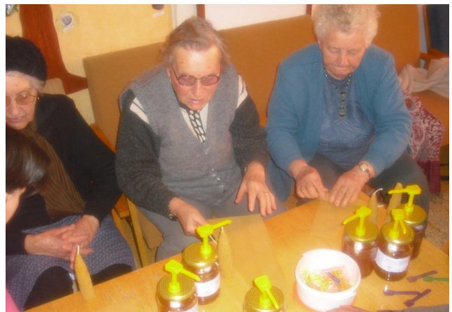
Míg a gyerekek új technikákkal ismerkedtek meg, addig az Idősek Klubjában gyertyát készítettek.