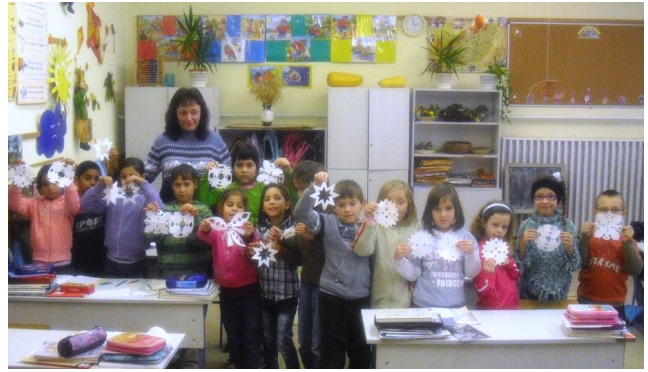
Az elsősök az óvodában adtak műsort, a másodikosok pedig hópihéket varázsoltak az ablakokba.