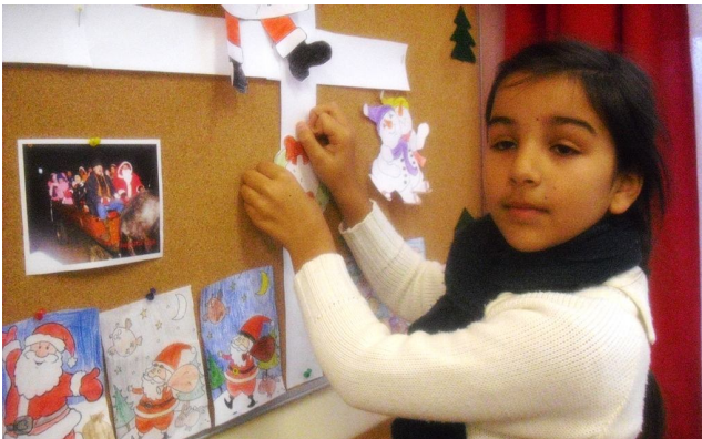
Teremdzsítés a várakozás jegyében a 3. osztályban.