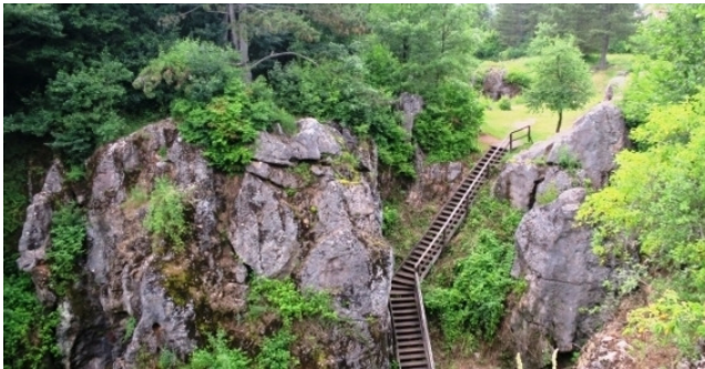
Az úrkúti öskarszt

Idén is megtartotta nyári táborát gyülekezetünk legfiatalabb ifjúsági csoportja, a Juvenisz ifi. A csapattal július 9-15. között Úrkútra mentünk, gyülekezetünk konferenciaközpontjába. Idei táborunk délelőtti előadásai a „Szabadság” témakörét járták körül, esténként pedig Noé útját követtük végig az özönvíz történetén keresztül. Hétfőn délután a szállás elfoglalását követően kihelyeztük az ifis üzenő falat, melyre a hét folyamán bárki írhatott, üzenhetett, gondolatokat oszthatott meg a többi táborlakóval. Vacsora után esti alkalmunkon arról hallhattunk, hogy milyen a világ az ember szemszögéből, és milyen Isten szemszögéből. Hogy Noé kora, és a mi korunk is lehet technológiailag, gazdaságilag virágzó, de Isten más mércével ítél, mindenestől megromlottnak és gonosznak nevezi a világot. Hallhattunk Noéről, aki a „DE” embere volt a maga korában, aki viselkedésével, gondolkodásával, életével ellentéte volt mindannak, ami a világ volt körülötte, és hogy az Isten az ilyen „DE” emberekre bízta az ügyét ma is. Az este második felében pedig csoportos