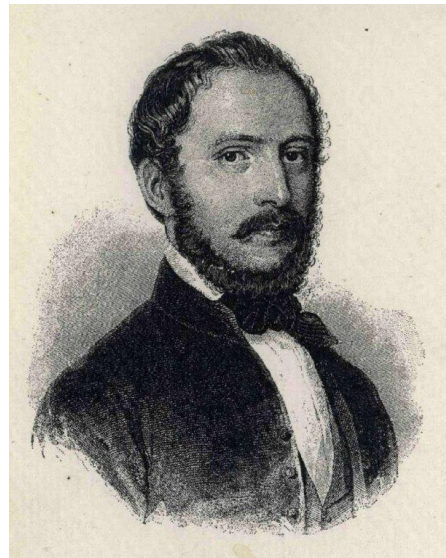
Tompa Mihály (1817-1868)

Virágok és füvek harmatban ferdének, Nyugodt, setét az éj; a holdvilág lement, - Ahonnan áldással száll e lágy permeteg: Az én lelkemre is szálljon le béke, csend! Hogy a sír hús gyepén nyugatva homlokom, Hígyek, reméljek s ezt lehessen mondanom: Ha elvesztettem itt, majd feltalálom ott ...! Legyen meg hát Uram, te szent akaratod!!