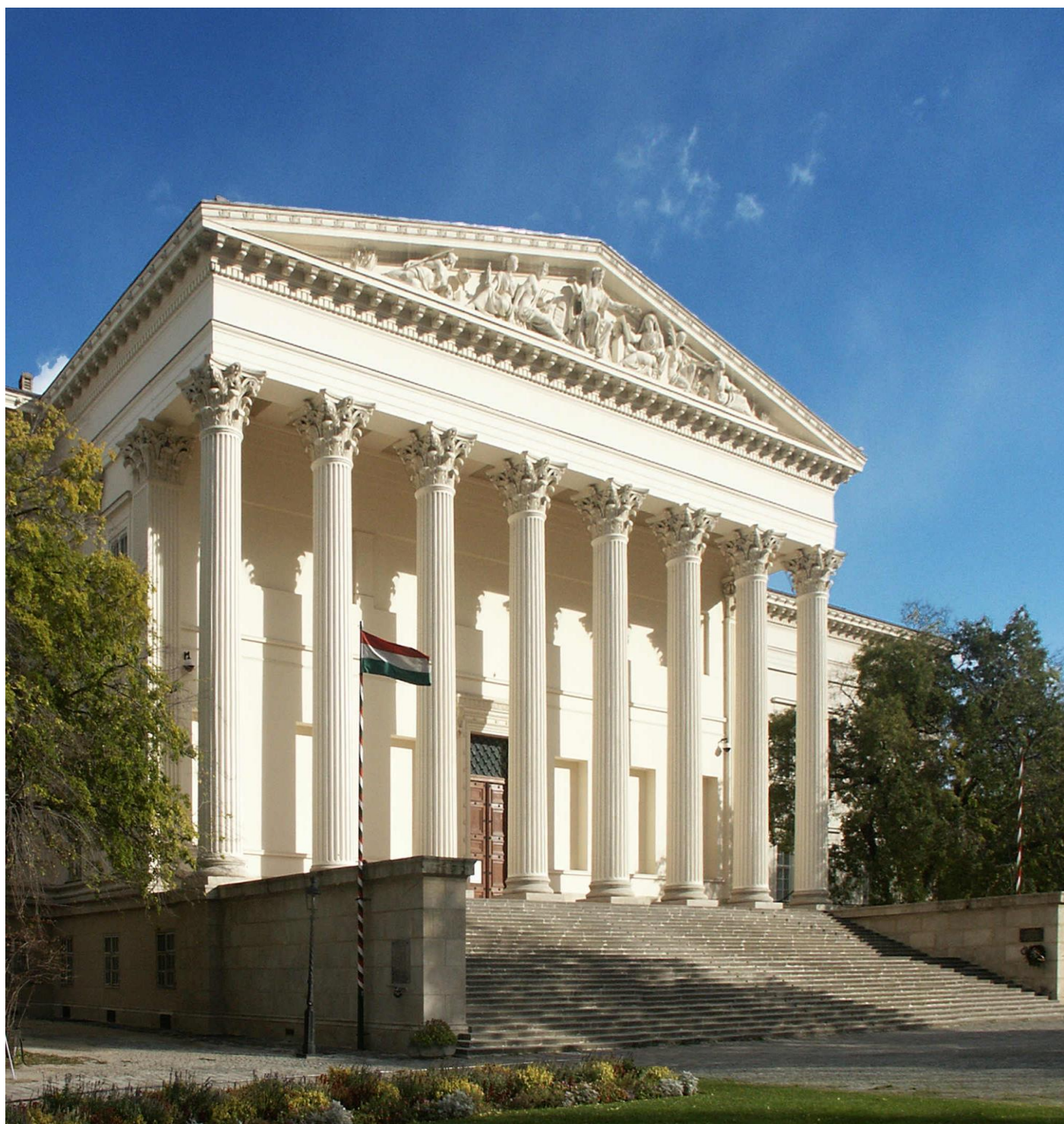
Pollack Mihály, Magyar Nemzeti Múzeum

Gyülekezeti hírmondó: a Pesterzsébet Központi Református Egyházközség kiadványa.