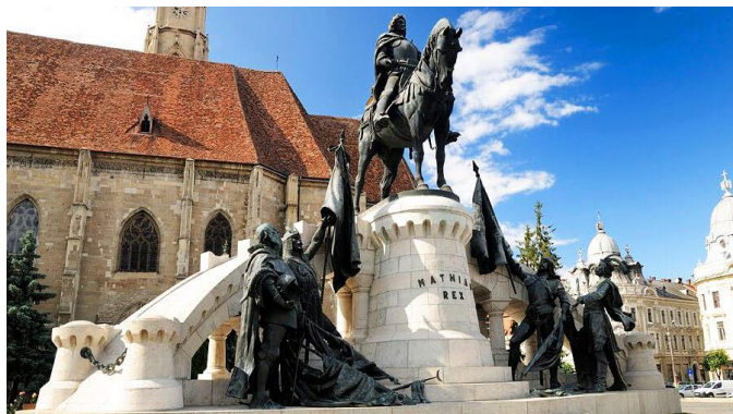
Fadrusz János: Mátyás király

Megszületett Fadrusz János szobrász (Mátyás király lovas szobra Kolozsvárott).