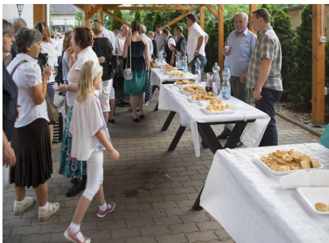
Szeretetvendégség a hangverseny után

Bartók Béla zeneszerző hamvait örök nyugalomra helyezték a budapesti Farkasréti temetőben.