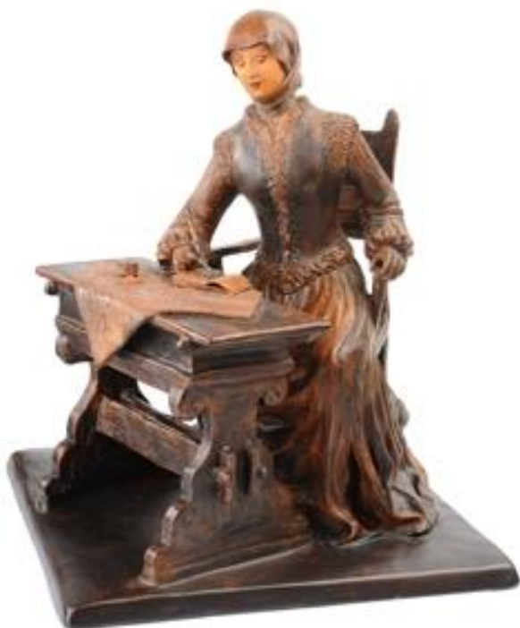
Józsa Judit: Lorántffy Zsuzsanna (magyar nagyasszonyok sorozat)

Meghalt a mecénás fejedelemsasszony, Lorántffy Zsuzsanna.