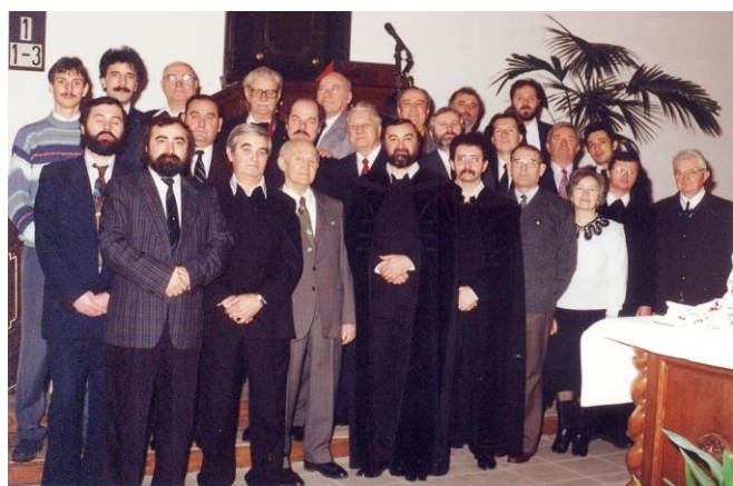
az egykori presbitérium

Április 1. Gyülekezetünk lelkipásztora 30 éve szolgál Egyházközségünkben.