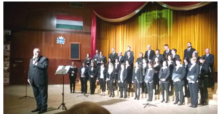
a kórus a Csiliben

Január 22. kórusunk szolgálata Magyar Kultúra Napja alkalmából rendezett ünnepségen a Csili Művelődési Központban.