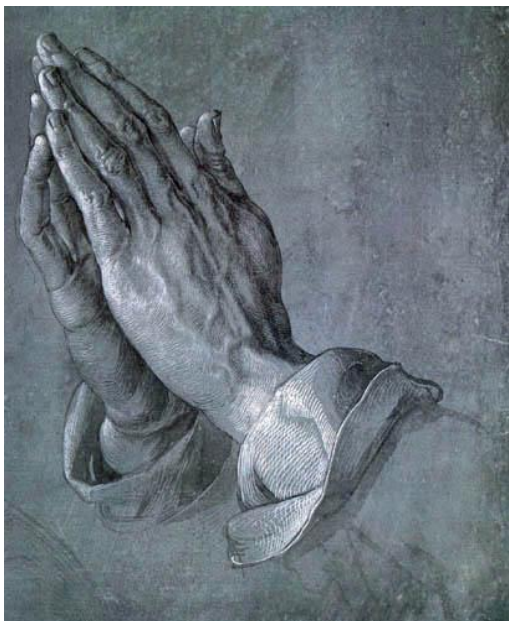
Albrecht Dürer: Imádkozó kezek