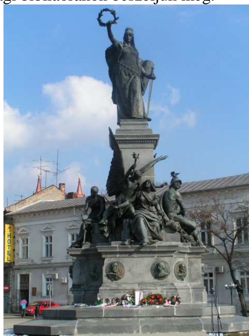
Zala György aradi szabadságszobra

Ezeknek időpontjait a csütörtöki és pénteki ifjúsági bibliaórákon beszéljük meg.