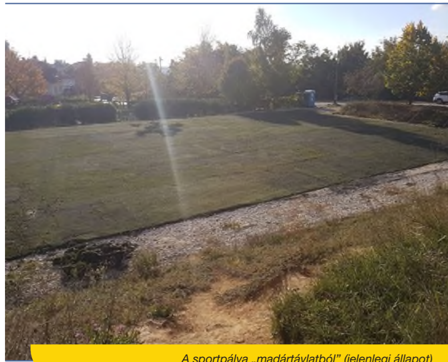
A sportpálya „madártávlatból” (jelenlegi állapot)

A valóban cselekvők számára természetesen érthetetlen az a negatív kritikái hozzáállás, ami a pálya építési folyamatát ürügyül használva ismét megfogalmazódik. Ugyan-