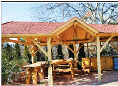
Egyedi, különleges kerti pavilon

Külső-, és beltéri lépcső, kerítés, kocsik beálló, előtető, beépített szekrény, konyhabútorkészítése, laminátpadló-lerakás