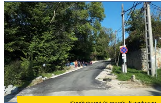
Kevélyhegyi út megújult szakasza

A Kevélyhegyi út elején, egy 50 méteres szakaszon új aszfaltreteg került lefektetésre.