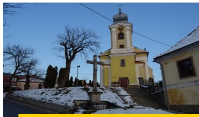
A Szent Vid Templom (Előtérben az új járda és úttest)