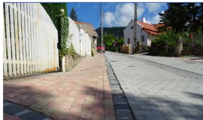
A Patak utca

Patak utca, Ezüsthegyí út alsó része – és a Fenyő tér, Vár utca, Erdő utca, Rózsa utca, Templom utca és a Patak utca felső, eddig murvás szakasza