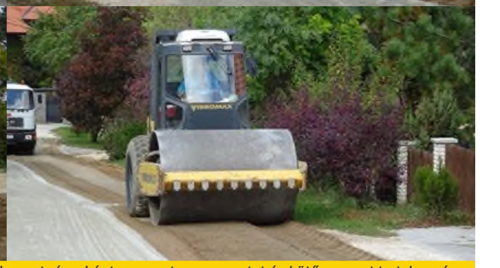
A Vincellér utca Terramix-es felújítása. (Mint látható, a folyamat részeként egy vastag, cementet és kötőanyagot tartalmazó réteget „darál” be az egyik gép az útfelületbe, melyet vízzel permeteztek be, majd hengerelték és marták a felületet.)