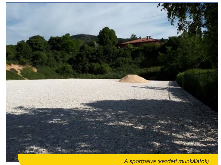
A sportpálya (kezdeti munkálatok)