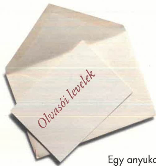
Egy anyuka írása