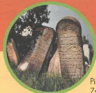
Pilisvörösvár, Zsidó temető