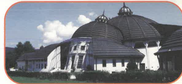
Piliscsaba, Pázmány Péter Katolikus Egyetem