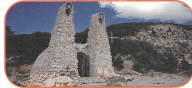
Pilisszántó, Boldogasszony Kápolna