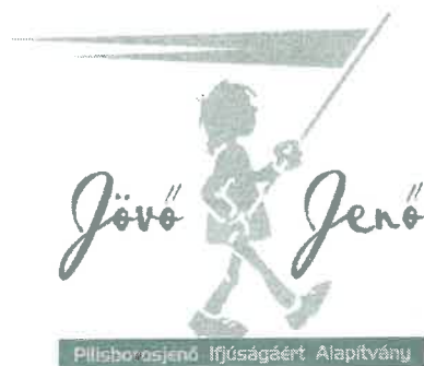
Pilisborosjenői Ifjúságért Alapítvány