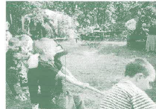
Madarak és fák napja a Kövesbérciben. Kötélhúzás közben.