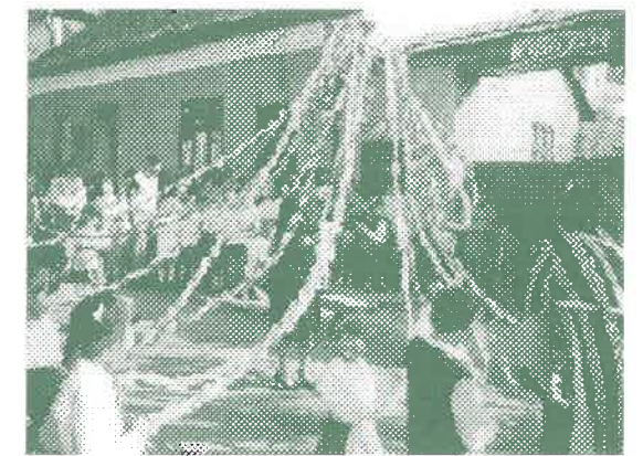
Május elseji zenés ébresztő és ünnepség