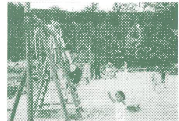
A Kihívás napján a játszótéren is sportoltak.