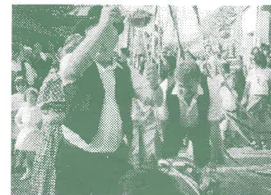
Szüreti mulatság, felvonulás.