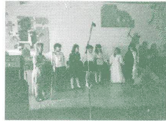
Aprófarsang, melynek bevételét a játszótér építésére fordították