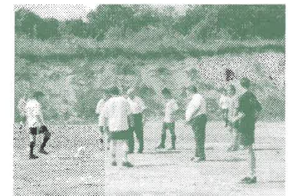
Focipálya avató mérkőzés