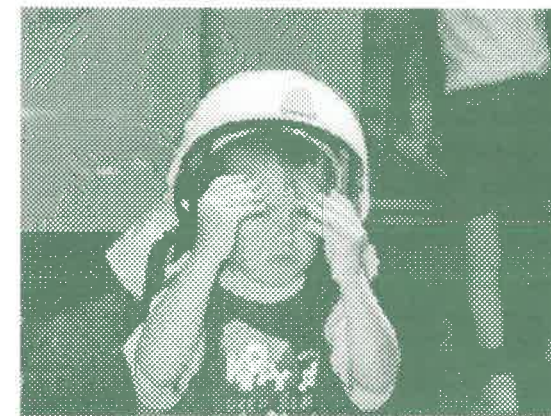
Gyermeknap. Nagy sikere volt a tűzoltóknak.