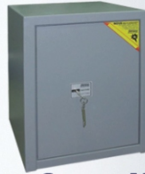
Strauss Metal Nova bútorszéfek