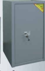
Strauss Metal ISZ-1 Iratszekrény