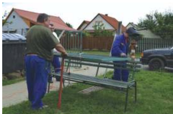
Folyamatos karbantartás az iskola területén.