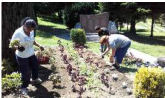
I. II. világháborús emlékműnél virágosítás.