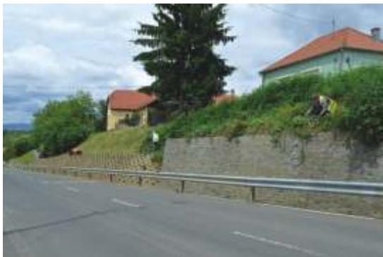
Öregfalui támfal gazolása.