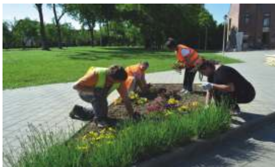
Virágosítás az önkormányzatnál.