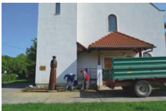
Talajelkészítés a református templomnál.