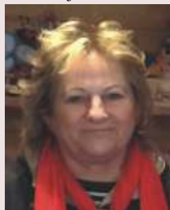
Mirbach Antalné 06-20/333-9989

Kozármislenyi középkorú, rendszeres hölgy teljes körű háztartási munkát vállal Kozármislenyben és környékén. Kérem hívjon bizalommal!