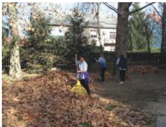
Óvodai lomb eltakarítása.