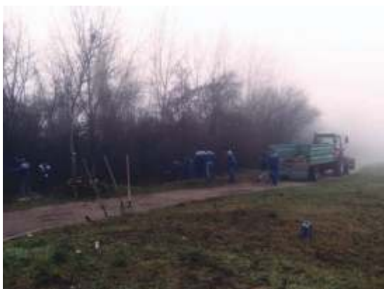
Új lakópark mögötti gazdasági út nyomvonalának megtisztítása.