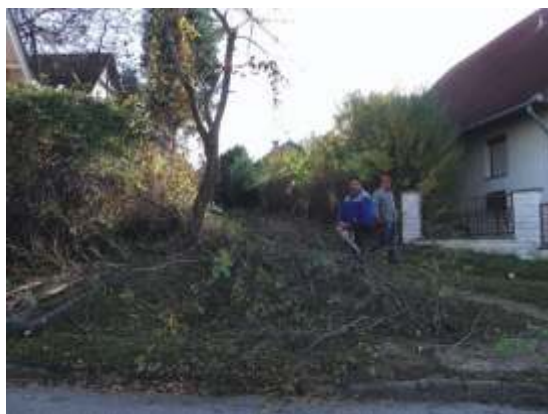
Radnóti köz járhatóvá tétele.