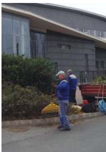
Parkgondozás a sportcsarnok előtt.