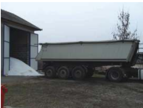
Téli útszóró só betárolása.