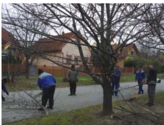
Útmenti fák gallyazása.