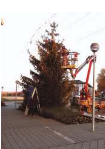
Mindenki karácsonyfájának kihelyezése.