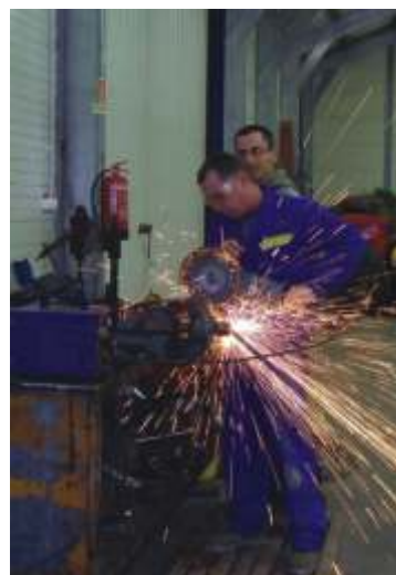
Gépfelújítás és karbantartás.