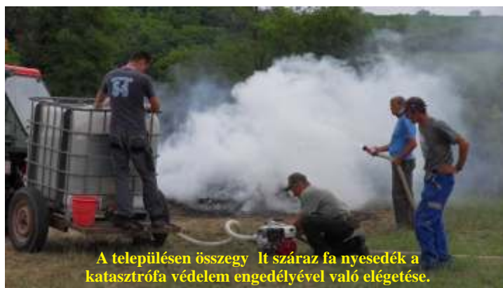
A településen összegyűlt száraz fa nyesedék a katasztrófa védelem engedélyével való elégetése.