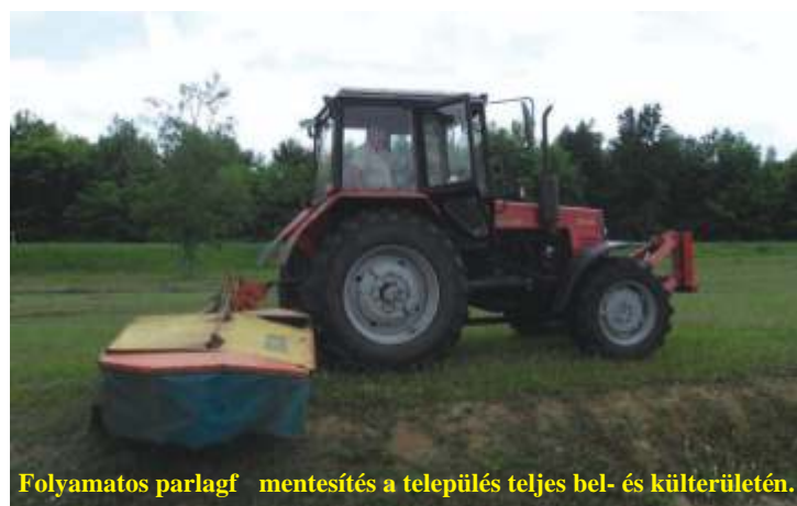
Folyamatos parlagmentesítés a település teljes bel- és külterületén.