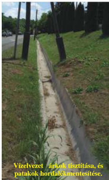
Vízvezet árkok tisztítása, és patakok hordalékmentesítése.