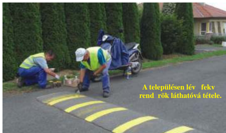
A településen lévő fekvőrendőrök láthatóvá tétele.