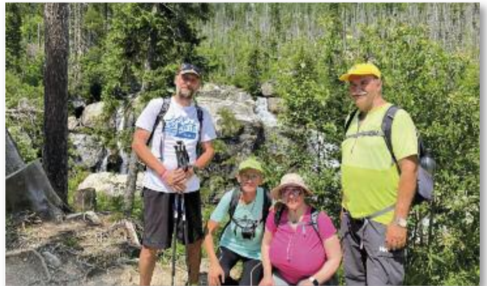
A két nap teljesítménye 35 km

lanovkára – amivel kétszer is utaztunk – a látvány lenyűgöző volt! Innen 1751 méterről kezdtük a túrát a Magiszt-