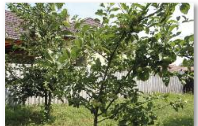
A 2019-ben ültetett almafák idén már sok termést hoztak

Soros összejevetelünket szeptember 6-án 15 órakor tartjuk a művelődési házban.