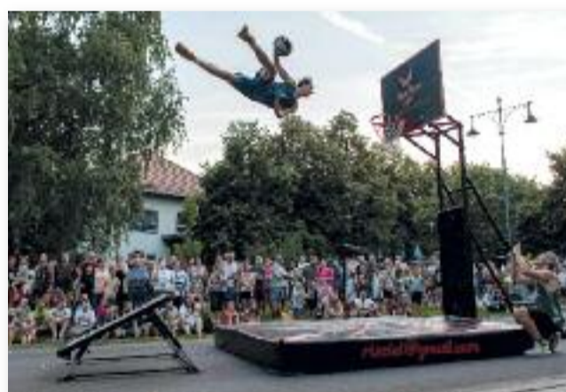
Az akrobatikus kosárlabda bemutató nagy sikert aratott

céllövölde, logikai sátor, kreatív foglalkozás, valamint babirodalom.