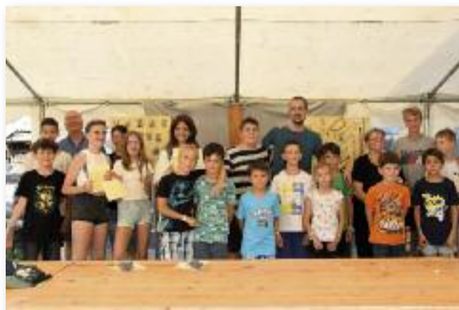
Számos program várta a táborban részt vevő 18 fiatalt

A heti események a rózsafüzér témakörére épültek. Minden nap reggeli tornával kezdődött, amelyet ima és elmélkedés követett. Helyet kapott a kézműveskedés, a sorverseny, a közös éneklés, a tánc, a zene és sok-sok játék. Tábori misét is tartottak. A programba egy visz-