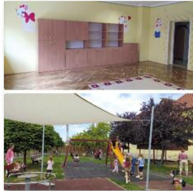
A nyári időszak lehetőséget biztosít a csoportszobák rendbetételére

Élményekkel teli nyár után szeretettel várjuk szeptemberben a kisgyermeket óvodánkban.