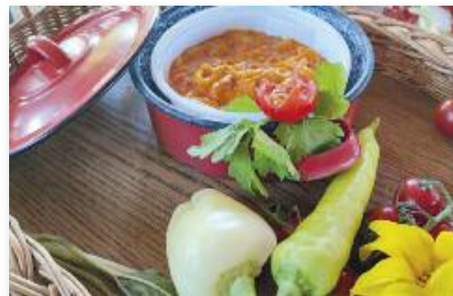
A hagyományos receptet csak kevesen választották

A rendezvény ragyogó napsütésben, családi légkörben telt, a beszélgetések kellemes duruzsolása és a hangos nevetések adták meg az alapzajt. A résztvevőket egy amatőr zenekar, a Talking Strings is szórakoztatta, többen táncra is perdültek a zene hallatán.