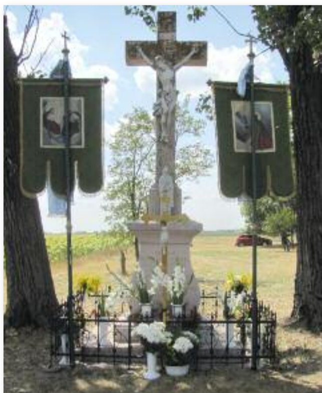
A 24. nagyárki búcsú emlékére

Mielőtt elköszöntünk volna egymástól, megbeszéltük, hogy az elkövetkező napokban kilátogatunk a nagyárki