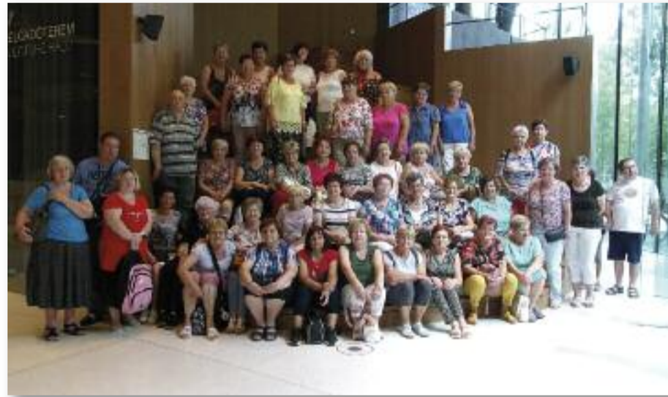
A Zene Háza egyszerre szolgál koncertek helyszínéül, múzeumként és oktatóközpontként is

Úgy gondolom, a kirándulás mindannyiunk számára maradandó élményt, gyönyörű természetközeli környezetet, csodás látványokat, kellemes időtöltést jelentett.