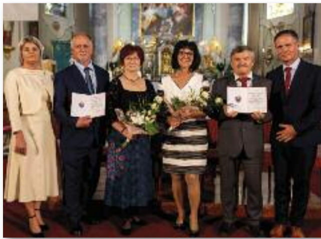
A szakmai kitüntetettek