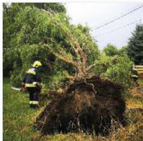
Jászárokszállás, Déryné utca, 2023. július 28.