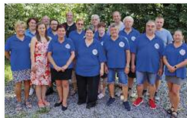
Nagygalambfalván és Zeteváralján is sikert aratott a Doktorkisasszony

Minden alkalommal örömmel térünk vissza mindkét településre, hiszen olyan mintha otthonról hazamennénk. Sok ismeretség, barátság kötött az elmúlt látogatások alkalmával, így az elő-