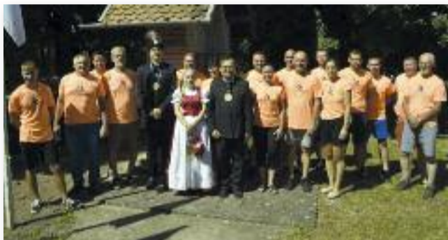
A 26. emléktúra kerékpárosai