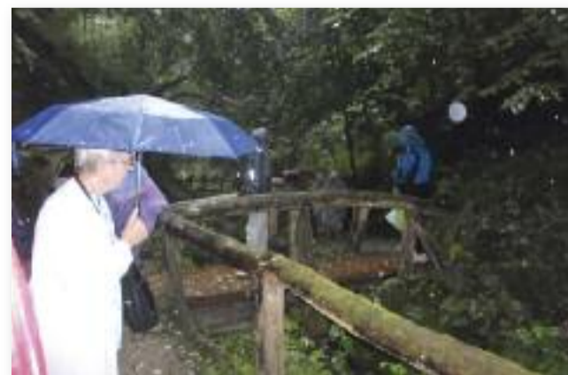
Akkor kell menni, ha jól esik

Bízom benne, hogy az eső ellenére is szép napot töltöttünk a múlt megismerésével.