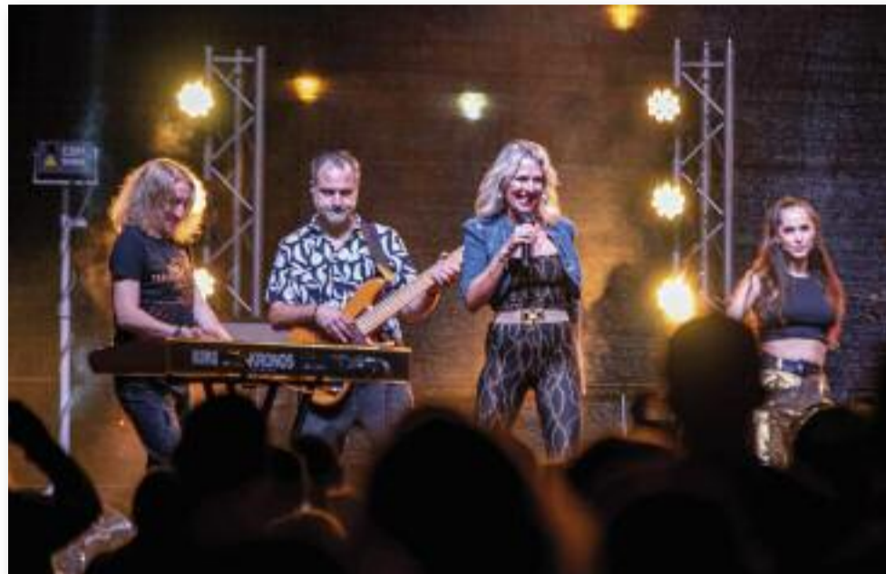
Wolf Kati nagykoncert

A Kiskalász gyermekzenekar élő koncertjét nemcsak a legkisebbek, de a felnőttek is élvezték. A több hangszert is megszólaltató együttes előadta legismertebb dalait: Palacsinta, Hepehupa. A koncert mellett a gyermekeket több kiegészítő program is várta: csillámtetoválás, arc- és hennafestés, ugrálóvár,