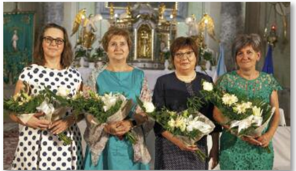
A szakmai kitüntetettek

Ebben az évben is négy szakmai kitüntetést adtak át. „Életműdíj a közszolgálatért” elnevezésű kitüntetés-