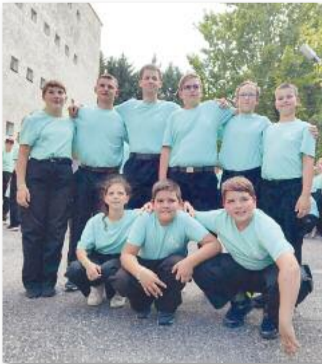
A balatonfüredi táborban számos szakmai ismeretet kaptak a fiatalok

A szakmai munka lezárásaképp szombat délelőtt szóbeli, írásbeli és gyakorlati vizsga keretében sikeresen számoltak be tudásukról annak ellenére, hogy fiataljaink nagyobb része még a vizsgarendszer szerinti életkort nem érte el. 17 órától táborzáró ünnepség került megtartásra. Külön öröm volt ennyi fia-