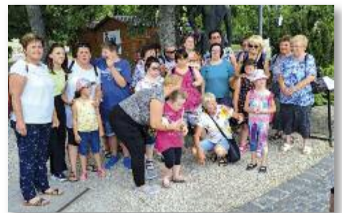
A kirándulás résztvevői

Ezt követően megebédeltünk, majd újabb rövid szabadprogram után a Magyar Vasúttörténeti Park felé vettük az irányt. Itt először egy kisvonaton ülve járhattuk be a parkot, amit kivétel nélkül mindenki nagyon élvezett. Majd egy régi vasúti vagonban megtekintettük a fogaskerekű és a mozdonyok makettjeit, melyeket a makettasztal oldalán található karokkal irányíthattak ketten, így életre kelhetett a kis állomás. A makettezés után szabadprogram keretében mindenki felfedezhette a parkot és az ott található, régi mozdonyokat - volt, amelyek