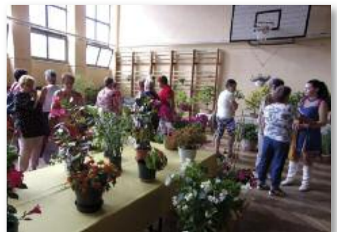
Virág- és dísznövénykiállítás az Árokszállási Nyáron

tuk a Budakalászi Gyógynövénykutató Intézetet, ahol elméleti és szakmai ismer-