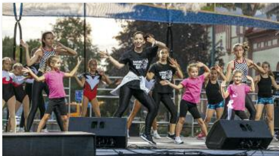
Dance Fitness SE bemutatója

Azok, akik még szívesen folytatták az önfelelt szórakozást, utcabálon vehettek részt Jászárokszállás Ifjúsági Tanácsa jóvoltából.