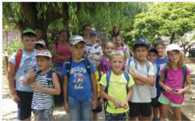
Kirándulás a Gyöngyösi Állatkertben

gyösi Állatkertben, ahol szép környezetben, árnyas fák alatt tekintették meg a zoolakóit. Találkoztak szurikáttal, tevékkel, vidrákkal, teknősökkel, oroszlánokkal és pávián családdal. Felfedezték a játszóteret, majd egy hűsítő jégkrémmel zá-