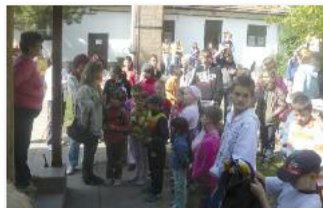
Nagyapáink nyomában, 2013.

2011-ben megrendezésre került a nyolcadik Jász Baráti Egyesületek Fóruma, ami igen jól sikerült és a résztvevők