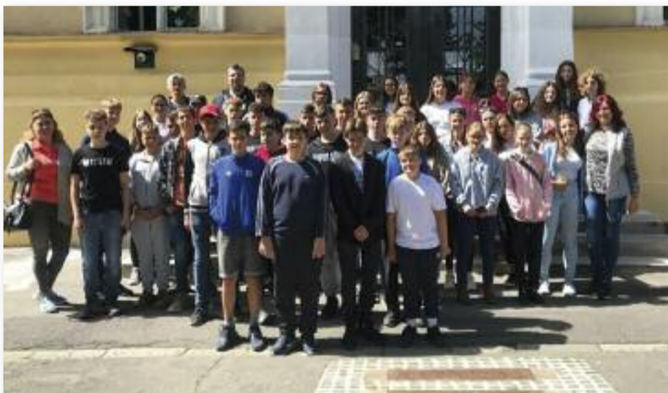
A történelmi Magyarország felfedezése

Majd a buszhoz indultunk, de ezúttal hazafelé vettük az irányt. A határnál letettük az idegenvezetőnket, majd utunk haza vezetett. Már mindenki várta, hogy láthassa szüleit. Miután hazaháztunk hosszú élménybeszámolót tartottunk otthon a kirándulás során szerzett élményeinkről.