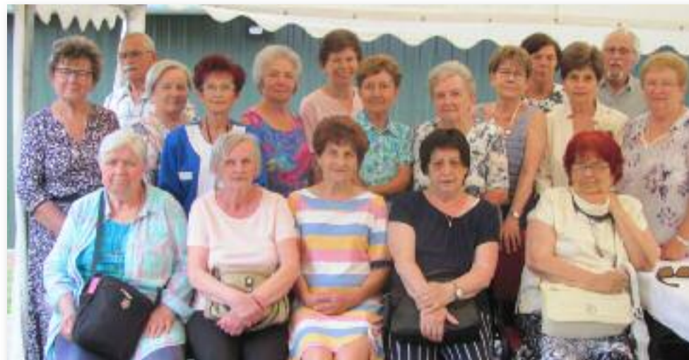
Az 1967-es évfolyam

Ezek után élménybeszámolót tartottunk, ami magába foglalta többek között az egészségi állapotunkat is, de legnagyobb élménnyel az unokák kerültek előtérbe. A