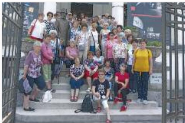
Felfedeztük Békés megye nevezetességeit

A hallottak és a látottak mindenkit lenyűgöztek. Érdemes volt ezzel a messzi vidékkel is megismerkednünk, mindannyiunk számára maradandó élményt jelentett.