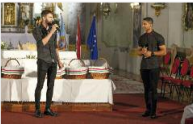
A gimnázium diákjainak műsora