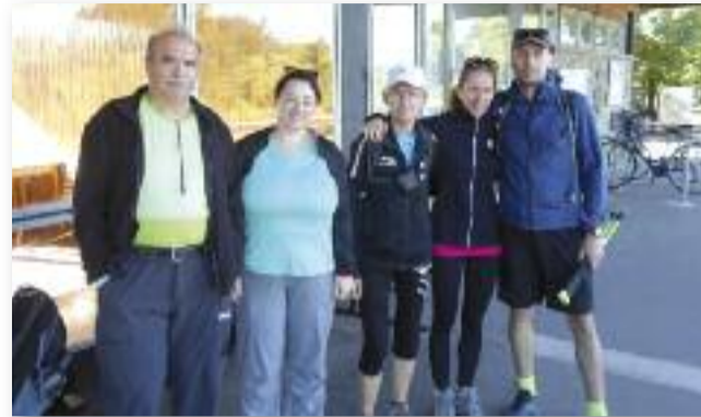
A Balaton-felvidék csodáinak felfedezői

ton-medence nyugati részére. Már ezért a látványért is megérte ide felérni. Innen tovább haladunk, majd egy újabb kilátóhelyhez (Egry József-kilátóhely) érünk. Ettől a ponttól már nem a hegytető peremén haladunk, hanem elhagyva az