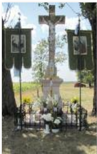
A leszármazottak tiszteleteként rendben tartott kereszt

után, a szertartás végén körmenettel és szentségi áldással zárult a szentmise.