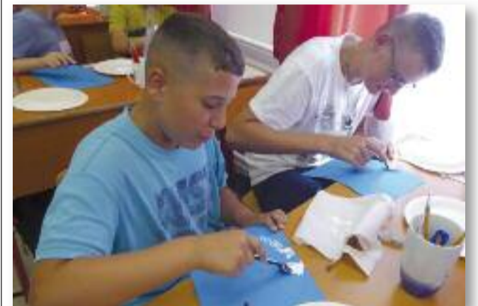
Táborozók alkotás közben

A III. Cukorka Tábor a gyerekeknek feltöltődést, új barátokat, lazítást és szórakozást nyújtott vidám és kellemes környezetben. Büszkék vagyunk rá, hogy vannak