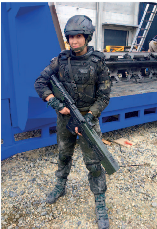
Amit a színész nem vállal, az a kaszkadőr feladata

Akkoriban sokat olvastam Piroch Gáborról, Magyarországon elsőszámú kaszkadőréről. Gábor 45 éven át tartó pályafutása alatt megannyi veszélyes feladatot vitt véghez. A földgolyón egyedül ő ugrott le 60 méter magasságból dobozokra egy budapesti autószalonn megnyitóján. 23 méter magasságból vetette magát a mélybe a biatorbágyi viaduktról, felgyújtották úgy, hogy ezer fokon lángolt a védőruha rajta. Nagy örömmel tölt el, hogy a legjobbtól tanulhatom a szakma rejtjelmeit. Mindig sportoltam, ezért még vonzóbbnak találtam ezt a hivatást. Az évek folyamán megtanultam vívni, boxolni, akrobatikázni, lovagolni. Lányként az ide vezető út nem könnyű, de ezt érzem sajátomnak. Ez nem az a szakma, amit napi nyolc órában művelsz, hiszen a forgatások alkalmasszerűek és érdemes mellette mellék munkát vállalni. A forgatások alatt sokszor utazni kell az ország minden tájára, néha külföldre is, attól függ, hogy az adott produkció milyen helyszínt talál a film megvalósításához. A kaszkadőrök sok mindenre tanított. Sokkal kitartóbb vagyok, mint azt gondoltam, sokat segített a koncentrációban, a pontosságban, a fegyelem-