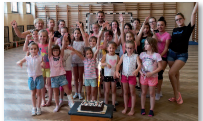
Csillag mazsorett csoport tánc tábor