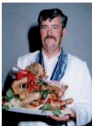
A vőfély munka közben

A menyasszonytánc közben, ha a vőlegény nem elég figyelmes, tréfából a barátai megszőktetik a menyasz-