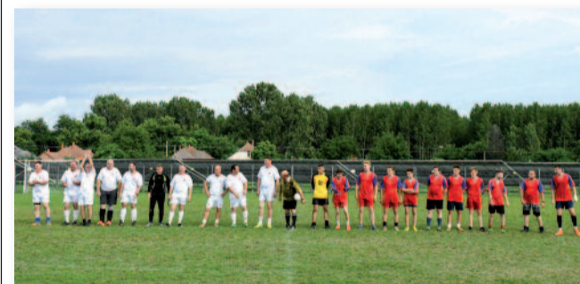
Öregfiúk az ifjúság ellen

ták a nap folyamán az érdeklődőket. A délutánt sportprogramok színesítették, ahol az amerikai foci rejtelmeibe is betekintést nyerhetünk. A gyermekek hetest, a felnőttek tizenegyest rúgó versenyen vehettek részt. A szemerkélő eső ellenére is a pályára léptek a lányok és az asszonyok, majd az öregfiúk az ifjúság ellen, hogy egy-egy