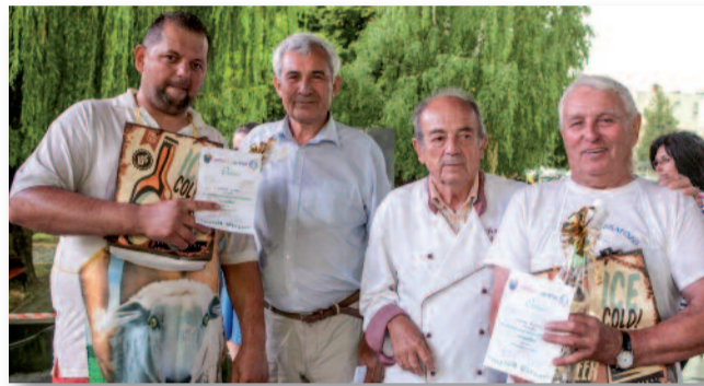
A legelhivatottabb versenyzők – Birkafőző Verseny, 2019

– PA: Igen! Remélem, nem jön közbe semmi akadály.