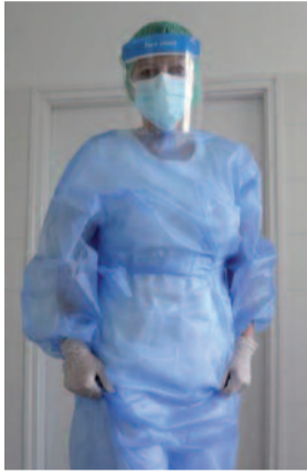
Teljes védőfelszerelésben, hogy megvédjük az időseket