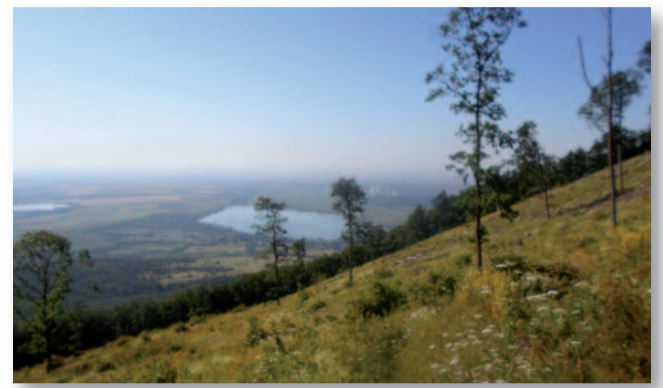
A kilátás minden fáradalmat megér

Megdöbbenünk azon, hogy miért kell ennyire lecsupaszítani a hegy oldalát! Talán a sokszínű virágok látványa