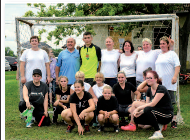
A lányok és asszonyok csapata

tották a szokásos ünnepi szentmisét, amely körmenettel zárult.