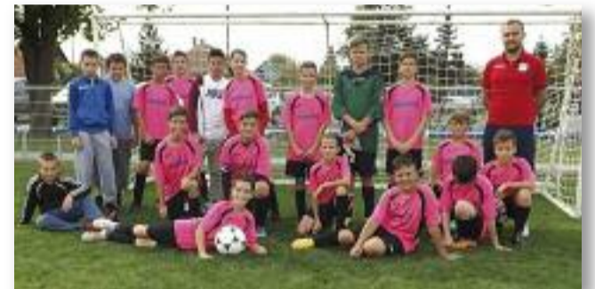
Az U13-as korosztály