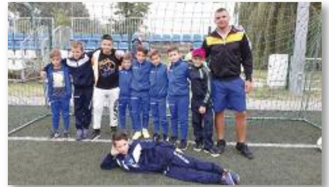
Az U11-es korosztály