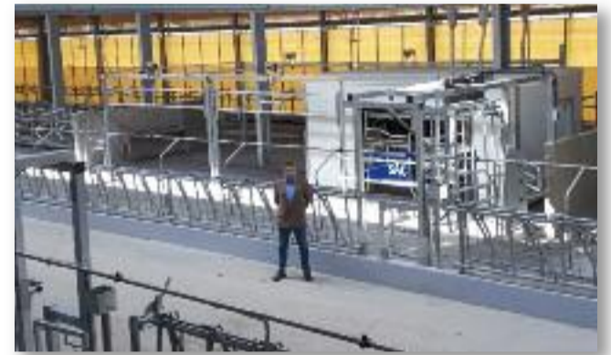
Háttérben a fejőrobot

tehen helyezhető el egy időben. Alapvető különbség, hogy az új istállóban beépítésre kerül a fejéstechnológia, amely 4 db dupla karos fejőrobotot