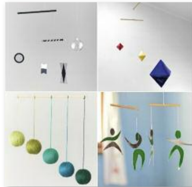
Munari, Oktaéder, Gobbi, táncoló körforgók

Most egy igazán egyszerű játékot ismertetek az olvasókkal: az öntögetős játékot.