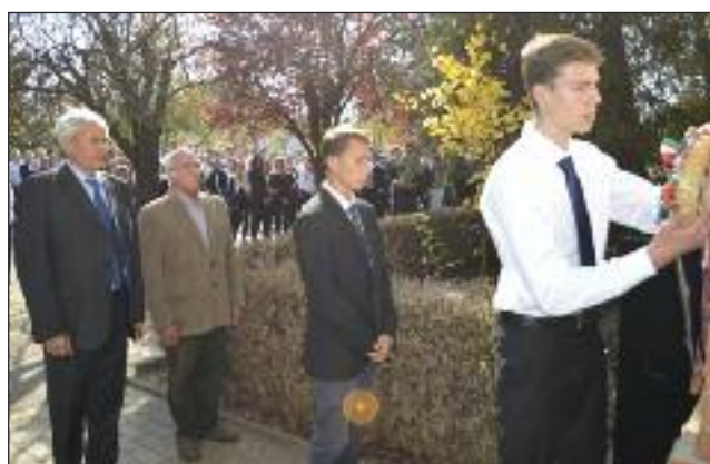
A polgármester úr és az alpolgármester úr koszorúznak