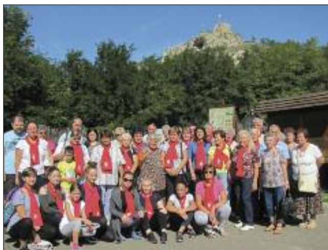
Karitászcsoport tagok kirándulása

leli élményt, hiszen „az egyház nevében, az evangélium szellemében tesszük a jót”.