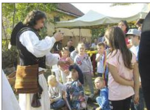
Működik a betyártanoda