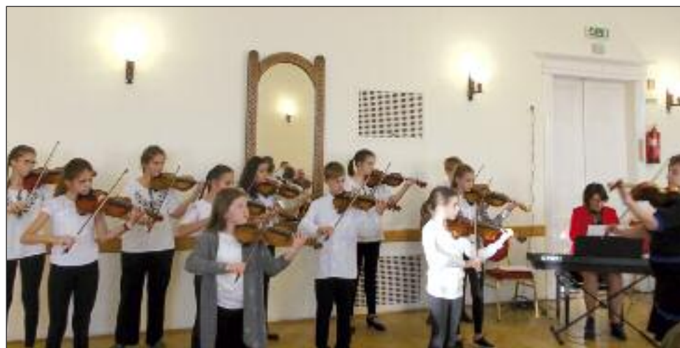
A Suzuki csoport hegedűjátéka

éreztek, hogy a zene az egyetlen világnyelv, melyet bárki bárhol megért, csodálatos dolog, megfoghatatlan, egy művészi kifejezési forma, mely gazdagítja a lelket, fogé-