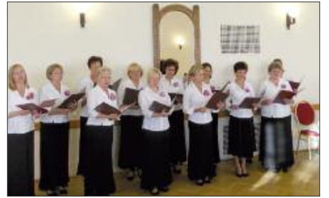
Elindultam szép hazámból... – énekeltek a Harmónia Kamarakórus tagjai

világnapjának nyilvánította. A hegedűművész azt kívánta, hogy ezen a napon minél több helyen, több hangszeren szólaljon meg a zene, melyet a kamarakórus tagjai, a zeneiskolásoknak és felkészítő tanáraiknak köszönhetően elmondhatunk: városunkban ez megvalósult.