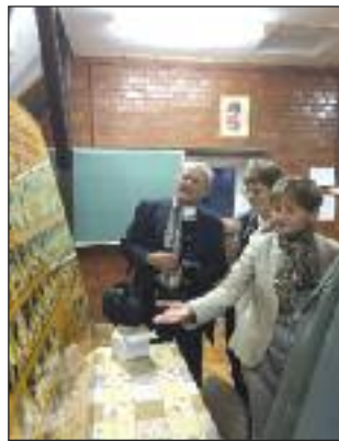
Ki kicsoda a tablón