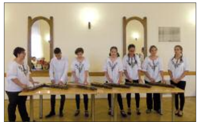
A Délibáb Citeracsoport moldvai énekeket énekelt és játszott

Yehudi Menuhin világhírű hegedűművész kezdeményezésére és javaslatára az UNESCO október 1-jét a zene