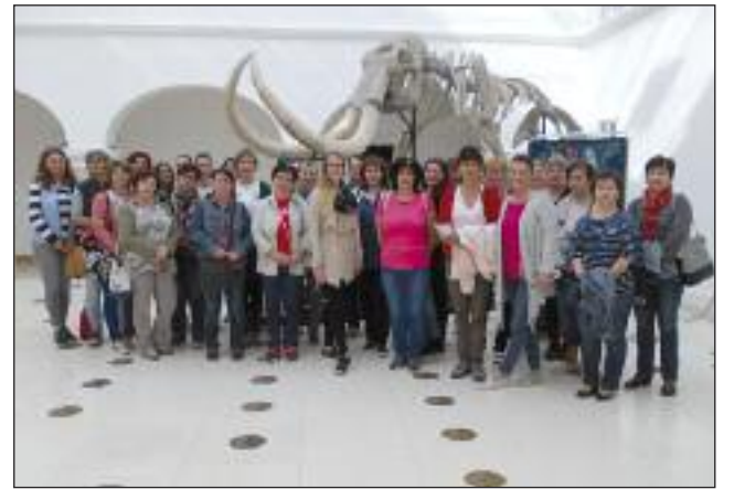
Kirándulók a Mátra Múzeumban

Ez évben is igen nagy érdeklődés volt az egri színház előadásai iránt. 150 alsó tagozatos tanulónk váltott bérletet a három előadásra. Október 24-én a Mátyás király juhásza című mesejátékot nézték meg, mely Mátyás király születésének 575., királyválasz-