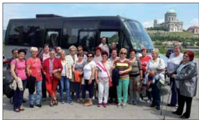
Párkányban a Duna partján

alig maradt valami, a kiállítás rendezői csak „korhű” bútorokkal tudták pótolni a berendezést. Számunkra azonban a látottak szeptember 21-én, a magyar dráma napján (1883-ban ezen a napon állították színpadra a „tragédiát” a Nemzeti Színházban) a költővel együtt azt a környezetet is felidézük majd, amelyben e