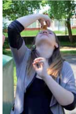
Egy perc és nyersz