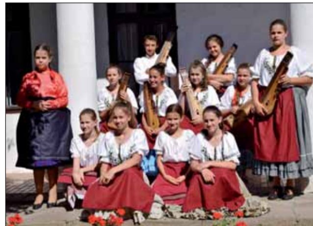
A győztes Délibáb, Gyöngykoszorú és Csirigli csoport tagjai

A nyár a pihenés, a feltöltődés időszaka. Iskolánk nyári napközti biztosít azon tanulóink részére, akiknek szülei dolgoznak. Közel 50 fő vesz részt úszásoktatásban a