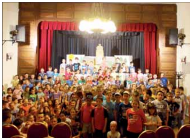
Gyereknapi bábelőadás a Művelődési Házban

Büszkeség és boldogság, mikor egy-egy tanítványunk ilyen szép sikert ér el, felémelő érzés hallani, hogy járszárokszallási versenyzőket szólítanak több ízben a zsűrihez díjak átvételére.