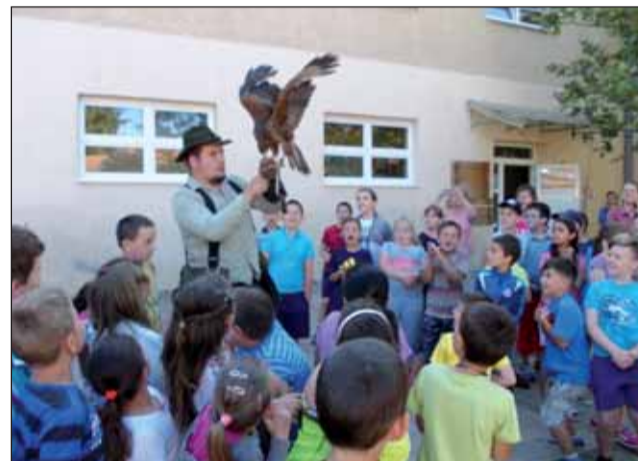
Solymászbemutató és az érdeklődő gyerekek

helyi strandon. A nyáron számos tábor közül válogathatnak tanulóink. A mazsorett csoportnak és a Fortuna tánc csoportnak tánc tábor, kalandos nyári tábor a Hon-