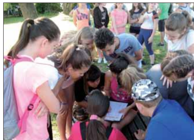
Most segíts, hogy mi legyünk a legjobbak

Az iskolák épületei 72 napig csendesek lesznek, hiszen a gyerekek vakációra mentek.