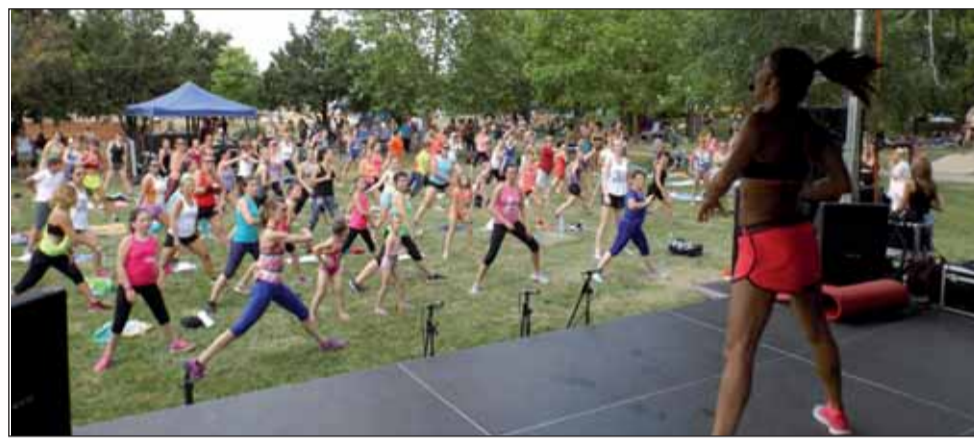
Rubint Réka és követői