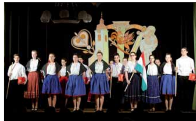
Jelenet a műsorból

A szabadtéri koszorúzás után a megemlékezés a Művelődési Házban folytatódott az általános iskola 7. évfolyamának műsorával, melynek címe: Bátor, büszke nemzet. A színvonalas műsor alatt minden jelenlévő átértékelhette a nemzeti identitás fontosságát,