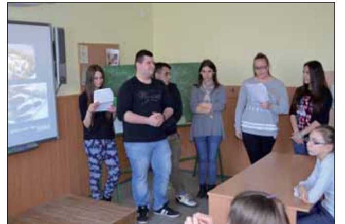
Jászárokszállási diákok előadása