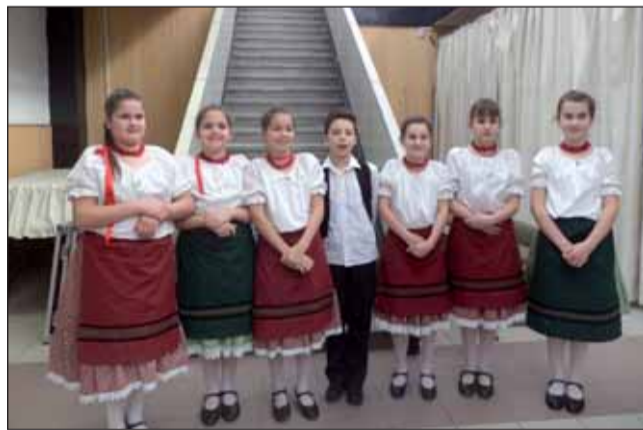
Az aranyérmes Gyöngykoszorú