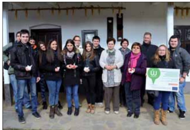
Elkészültek a hímestojások