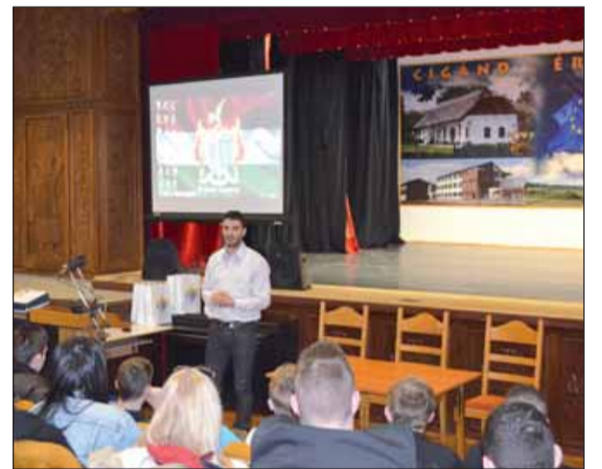
Az alpolgármester köszöntője

TÁMOP-3.3.14.A-12/1-2013-0157 „Testvériskolai kapcsolat kialakítása a Deák Ferenc Gimnázium, Közgazdasági és Informatikai Szakközépiskola és Kántor Mihály Általános Iskola között” című projekt