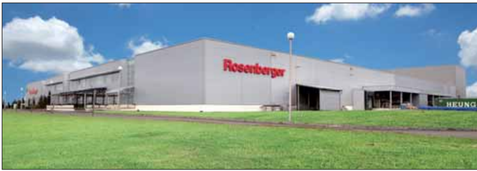
A Rosenberger Magyarország Elektronikai Kft. 1. sz. telephelye