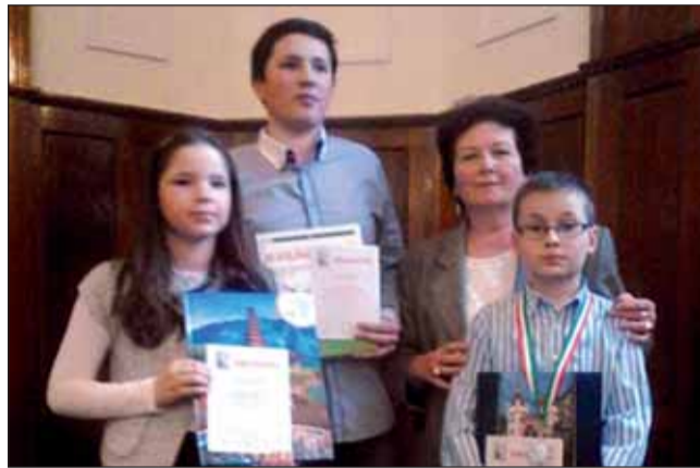
A legjobb matematikusaink és a díjazott tanító néni

3. előadást tekinthették meg színházbérletes tanítvá-