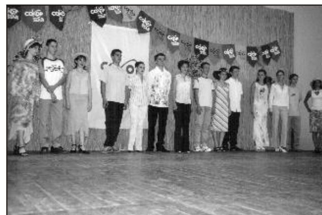
... és a Coop-Star Rt. ruháiba bújva

gyülekezők jóval többen vannak, mint a másnapi ünnepi színpad előtt. Így volt ez most is, akár a kora délutáni ifjúsági műsor idején, de a Fortuna táncbemutató ideje alatt is.