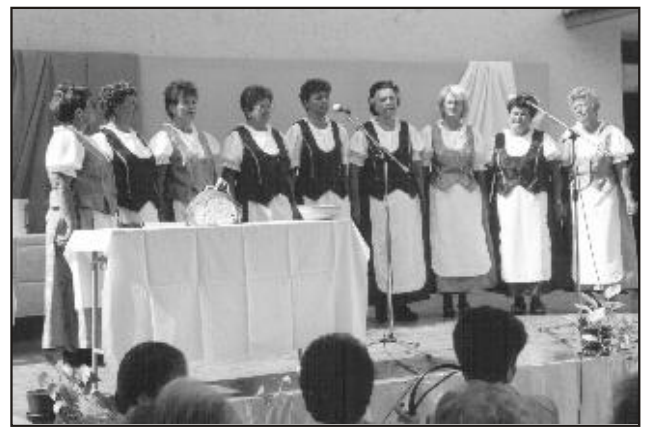
A Jászágói Népdalkör műsora

Augusztus 20. hagyománya városunkban, hogy 1996. óta ezen a napon ad-