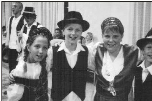
Képeinken a szüreti felvonulás résztvevői