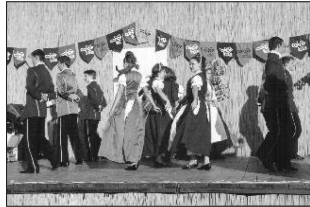
Fortunások Palotást járva ...