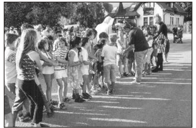
A színpad előtti játékoknak is nagy sikere volt

Jellemzője még az is, hogy e köré a színpad köré