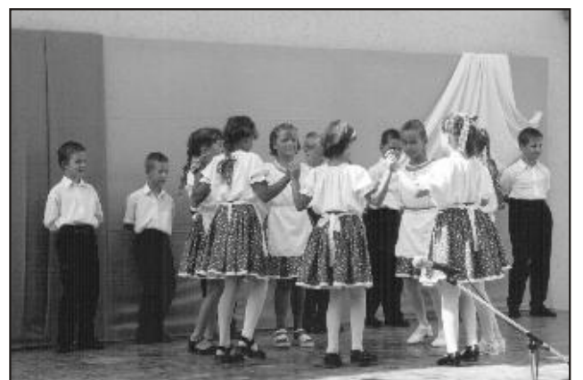
Színpadon az általános iskola tanulói