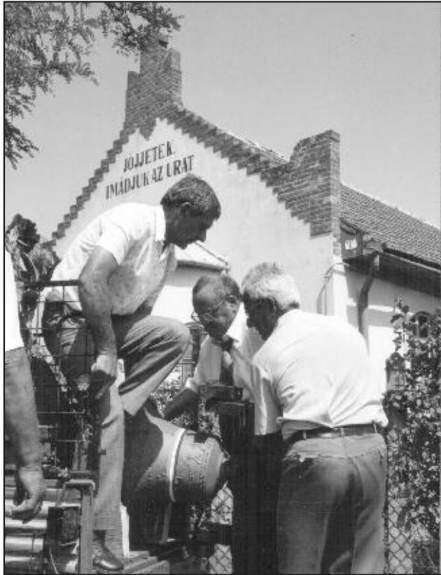
Ezúttal utánfutón szállították ki és be a harangot