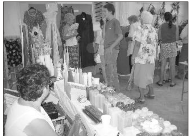
A kiállítás képe