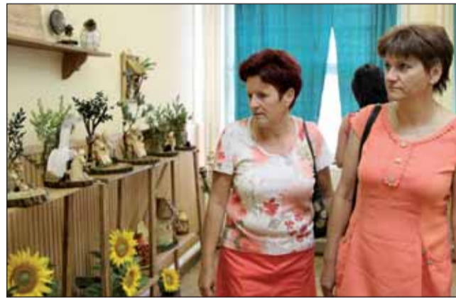
Az egyik kiállítás és nézői