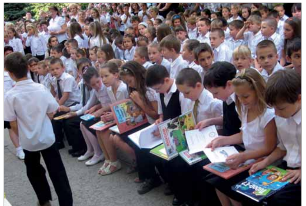
Könyv és oklevél a legjobb tanulóknak