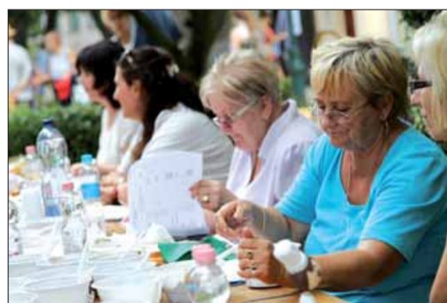
Munkában a zsűri

– Ballagó Anett