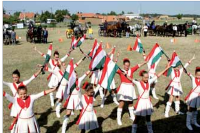
A megnyitó pillanata verseny előtt

A rendezvény napjára - július 6 vasárnapra - 45 nevezés érkezett a 9 órakor kezdődő meghívásos fogathajtó versenyre.