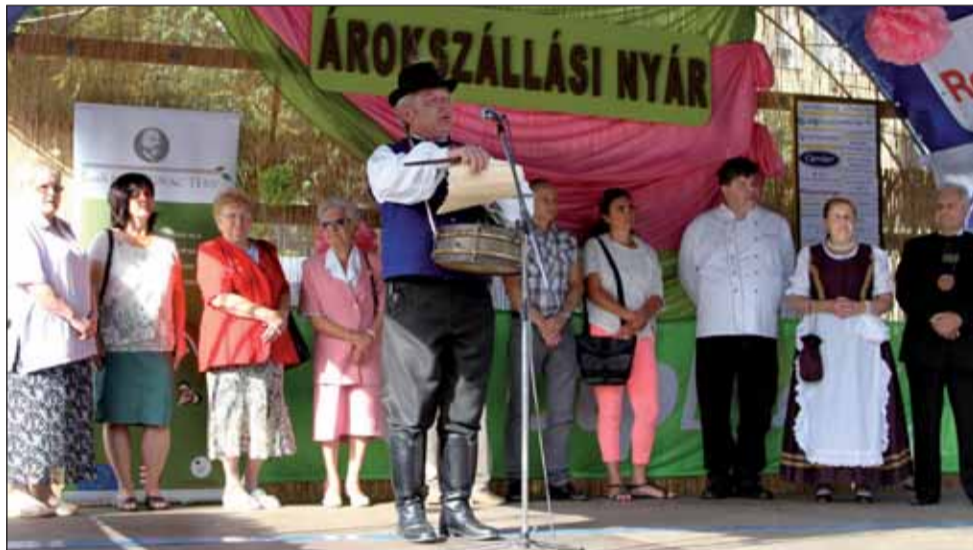
Közírré tétetik a nap főbb szereplőivel: Jászkapitány, zsűri elnök, zsűri tagok és támogatók

„Közírré tétetik! Kedves kérek. Addig, míg valami fon- vendégsereg egy kis csendet tosát mesélek. Ma hajnalban