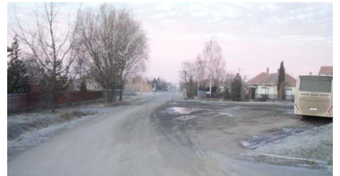
A Muszka kút utcája