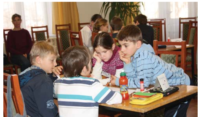
Igaz vagy hamis?