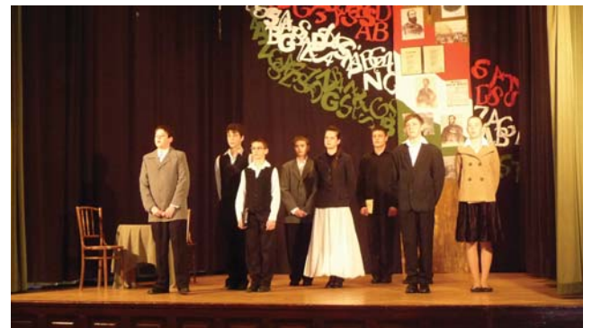
Márciusi ifjak 2012 „A szabadság betűi” c. emlékező műsorukban