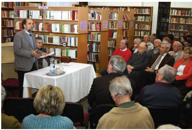
Az előadó az érdeklődő közönséggel

Idézte Jacques Elise Reculus munkájának néhány sorát, mely szerint a Kárpát-medence úgy, amint van, született államkerület. Ismertette az első, majd a második demográfiai katasztrófát. Az első nagy csapást a népvándorlási hullámok egymásutánja jelentette: „...a népesség lélekszámának jelentős mértékű csökkenése s ezen belül az addig többséget alkotó nép össznépségen be-