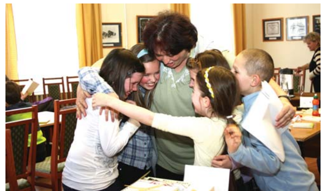
Az igazi öröm a győzelem