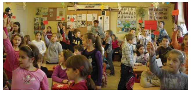
Igaz vagy hamis?