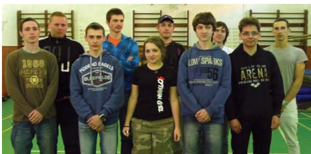
A Diákolimpia résztvevői