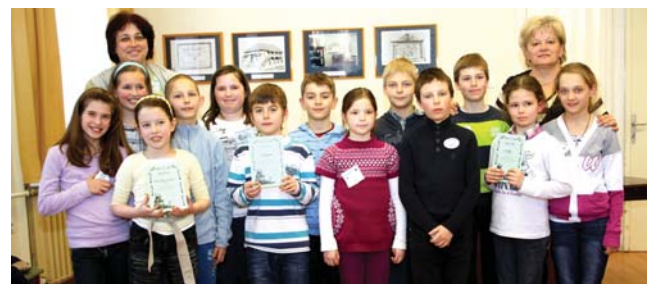
A területi forduló résztvevői