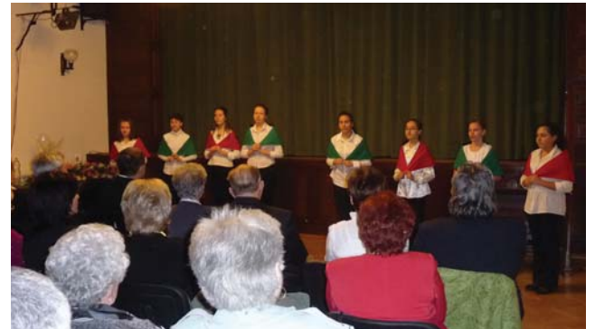
„...gyönyörű március, szeretlek százezer éve”