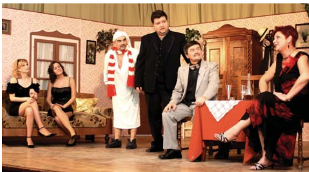
Kit rejt a szekrény?