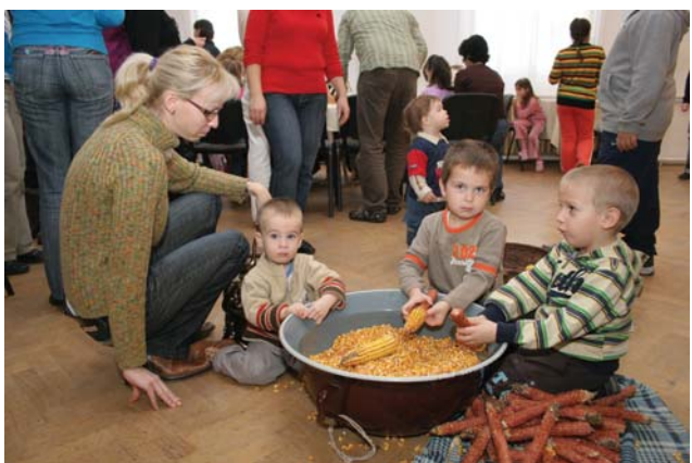
Hagyományt őriznek - morzsolnak