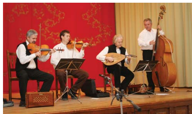
Táltos együttes a színpadon

A város vacsorával köszönte meg együttesünknek az egész évi szerepléseit és