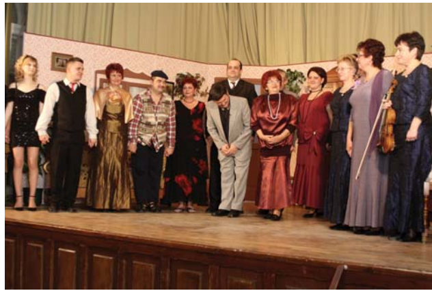
A társulat