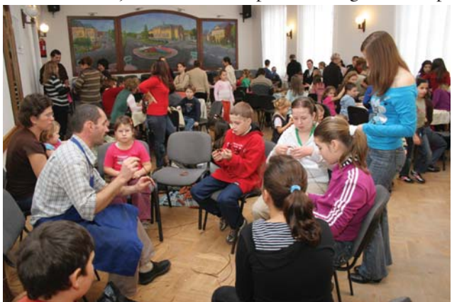
A kosárfonás alapjai