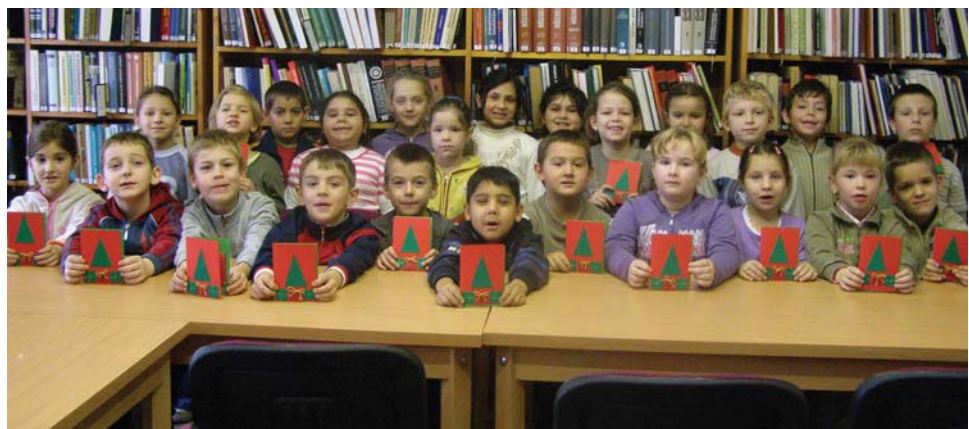
1. a - Elkészült a képeslap