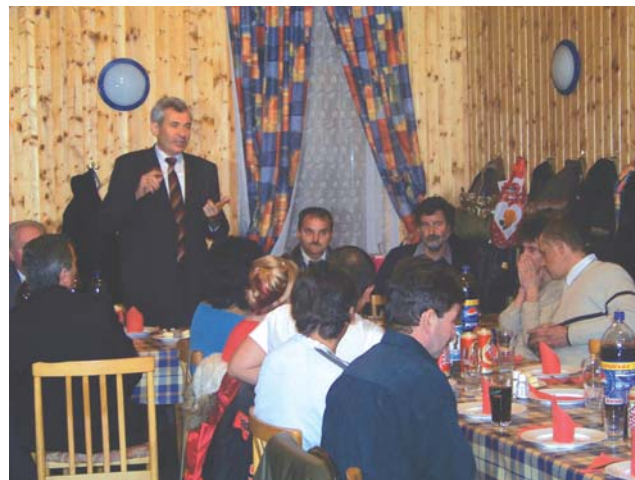
Polgármester köszöntő a polgárőr vacsorán

Jelenleg 28 aktív tagja van a helyi szervezetnek, mely ebben az évben is növelte az előző évhez képest teljesített szolgálati óraszámot, ami nem kis áldozattal járt a tagok részéről, hiszen a munkájuk, munkahelyük mellett szabadidejüket felál-