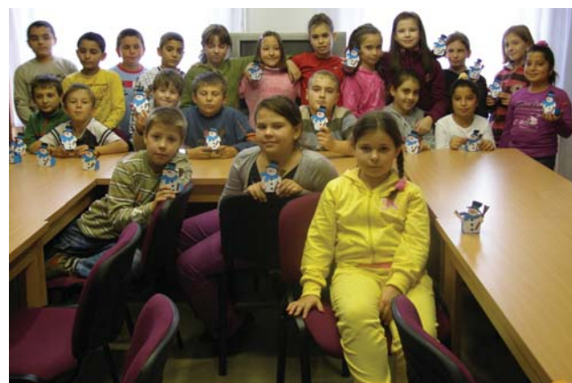
4. a - Mi már a hóra várunk

A Városi Könyvtár szeretettel meghívta településünk alsó tagozatos osztályait (12 osztály) télvári kreatív foglalkozásokra. Színes papírból, kartonból készítettünk az első osztályosokkal karácsonyi üdvözlőlapokat, a második, harmadik és negyedik osztályosokkal pedig hóembert ajándékdobozkával. Zenehallgatással és pár szem szaloncukorral édesítettük az ünnepváró vidám hangulatot.