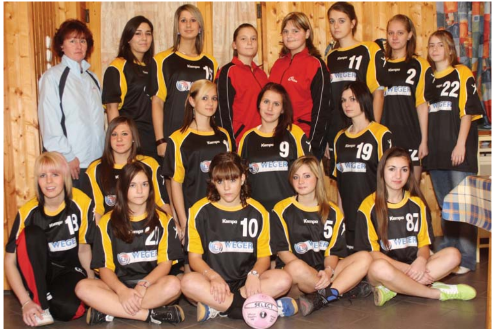
A JVSE Kézilabda Szakosztálya mindenkinek megköszöni a 2009. évi támogatást és minden támogatójának és szurkolójának kellemes karácsonyi ünnepeket és boldog új évet kíván!