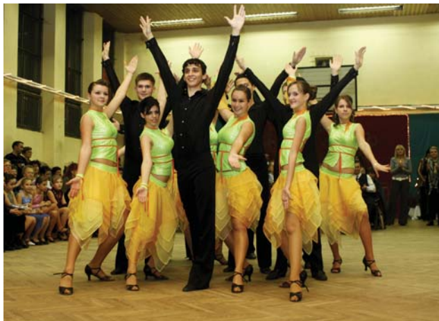
Jubileumi formáció ... és a Mikulás

mények és egyéb tárgyak), amelyek értékét növelték, hogy a szülők, gyerekek és az óvónők közösen és saját kezűleg készítették el. A vásár bevételét az óvodás gyerekek karácsonyi ajándékozására és kirándulására fordítják. Ezután a gyerekek kis műsorral, vidám énekekkel készültek a nagy találkozáshoz, amely nem is váratott magára oly sokat. Hamar megérkezett a nagyszakállú, piros ruhás télapó, akinél volt mindenféle jó. Gyümölcsöket, édességet osztott a gyerekeknek, akik vidám énekekkel köszönték meg az ajándékoszt. Virgácsot persze senki sem kapott, így hamar elszállt ez a vidám, jó hangulatú délután!