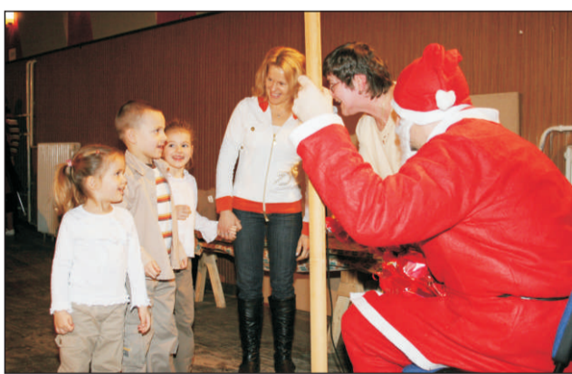
Vájon az igazi?

Mint minden évben, most is nagy érdeklődés mellett rendeztük meg – az Árok szállási Téli Esték keretében – a Mikulásünnepséget. Az Ipartestület vezetőit mindig az a cél vezette, hogy ha le-