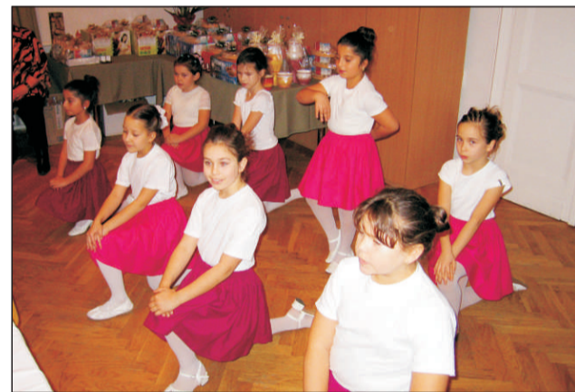
Tisztelet a véradóknak